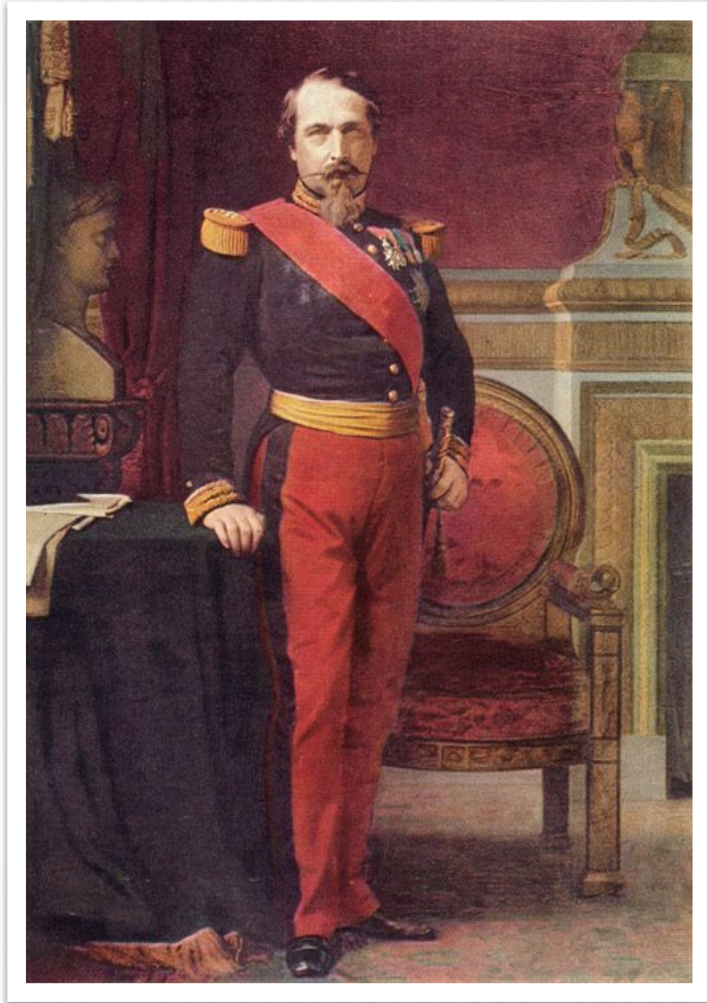
Луи Наполеон Бонапарт