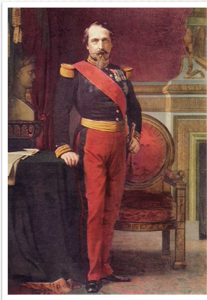
Луи Наполеон Бонапарт