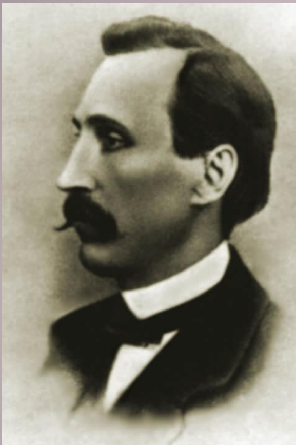
Кулиш Пантелеймон Александрович (1819 - 1897)