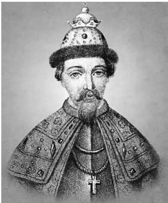
Семён Гордый (1317 - 1353)