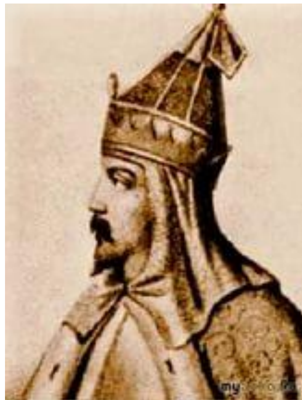
Иван II Красный (1353 - 1359)