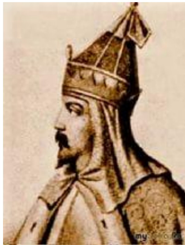
Иван II Красный (1353 - 1359)