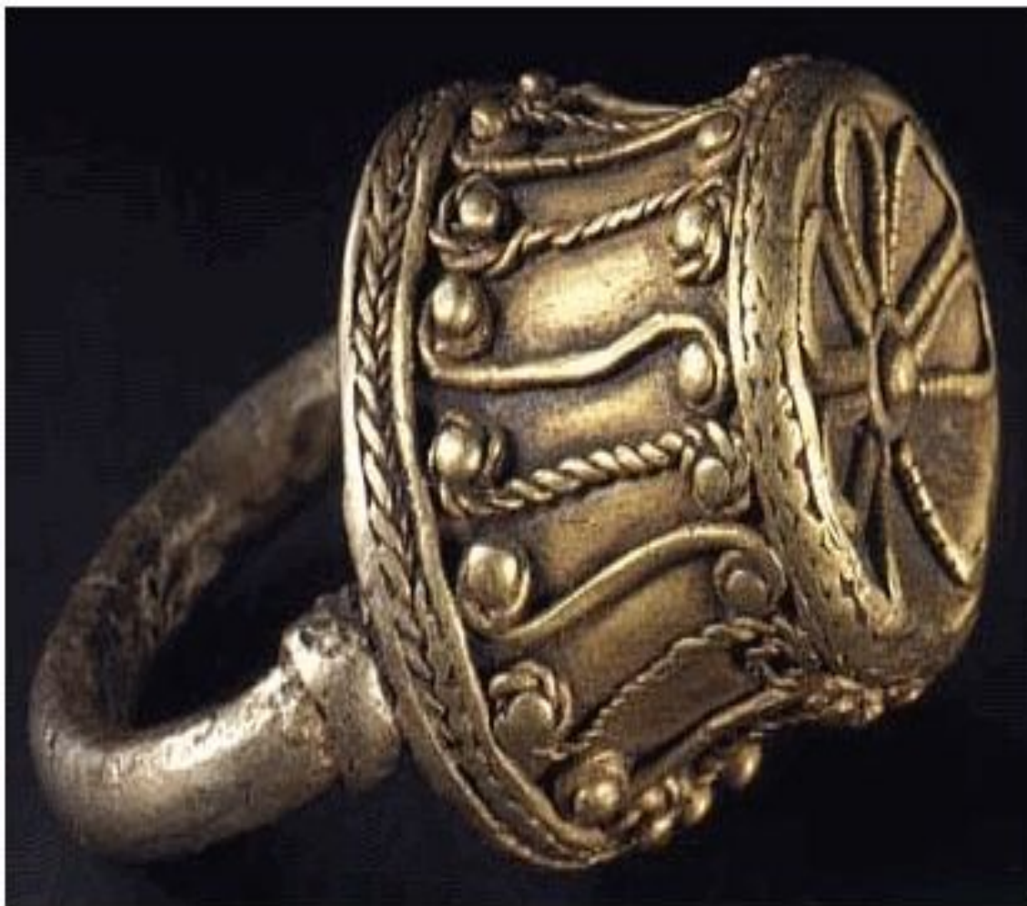
Перстень V в. до н.э. Золото Высота - 41,3 мм Найден возле с. Таганча, Черкасской обл. Раскопки Д.С. Кирилина, 1965