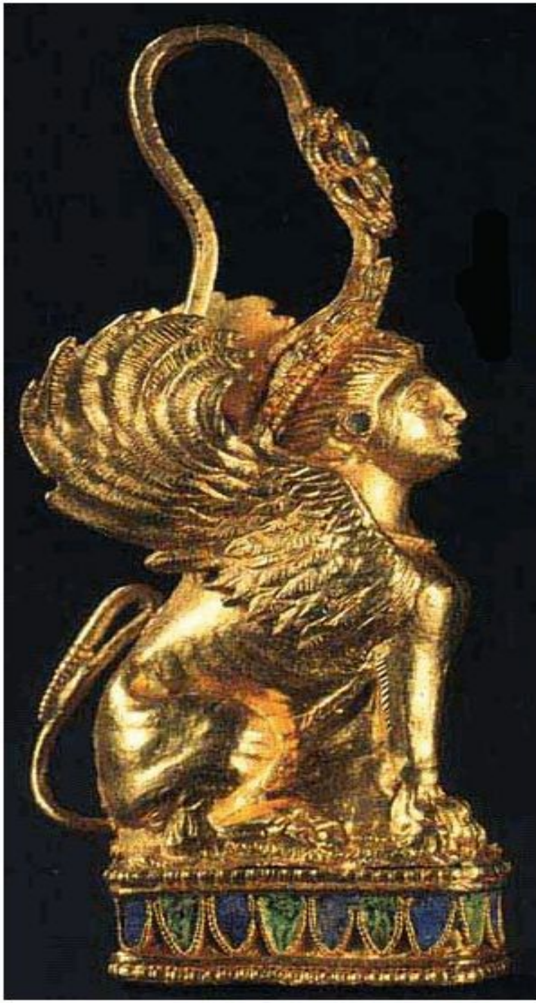
Серьга IV в. до н.э. Золото Высота - 47 мм Курган у возле Огоньки, Крым Раскопки Д.С. Кирилина, 1965