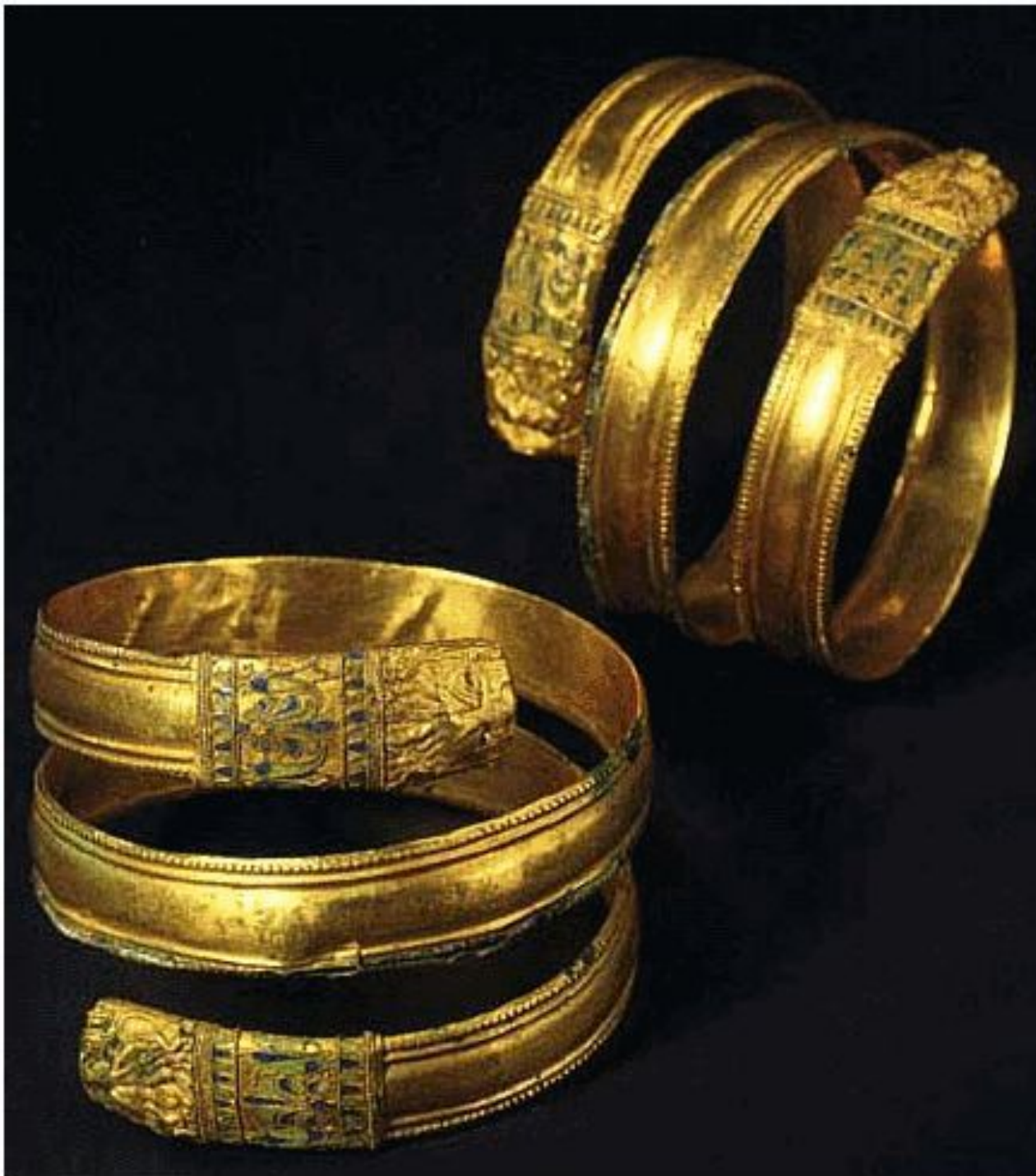
Браслеты IV в. до н.э. Золото, бронза Диаметр - 80 мм, 75 мм Курган у с. Огоньки, Крым Раскопки Д.С. Кирилина,