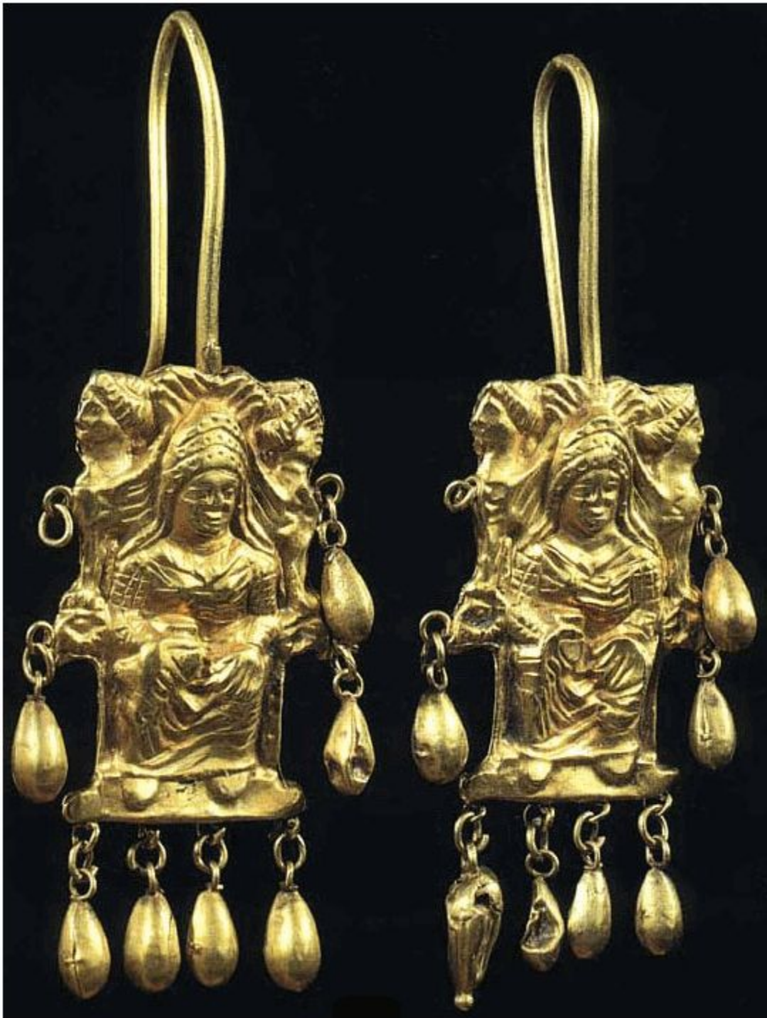
Серьги IV в. до н.э. Золото Высота - 82 мм, 80 мм Курган возле с. Великая Знаменка Запорожской обл. Раскопки В.В. Отрощенко, 1982