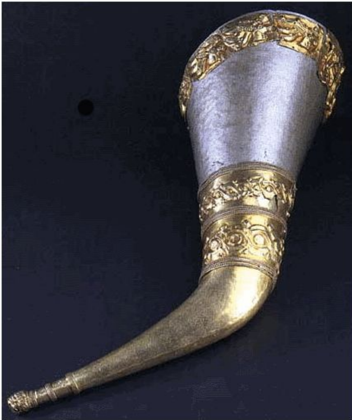
Ритон V - VI в. до н.э. Золото Размеры : длина - 445 мм, диаметр устья - 135 мм Курган у с. Великая Знаменка, Запорожской обл. Раскопки В.А. Отрощенко, 1984