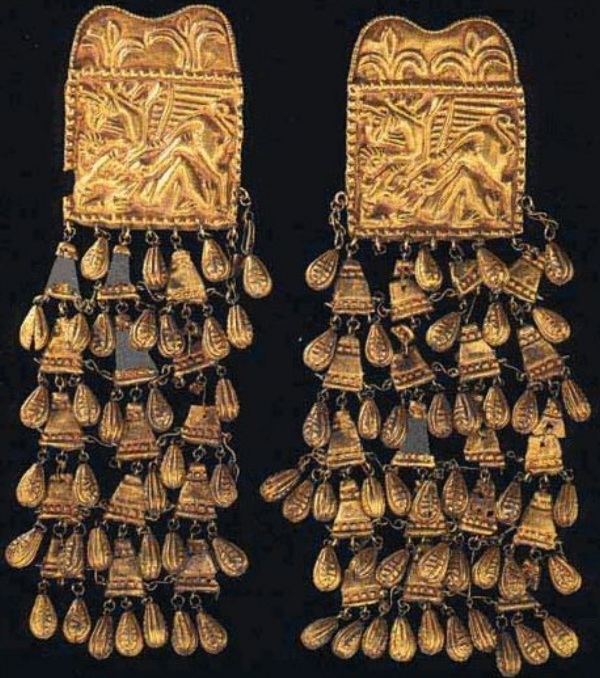
Шумовые привески IV в. до н.э. Золото Длина - 460 мм Курган возле с. Новоселки Черкасской обл. Раскопки А. Быдловского, 1901