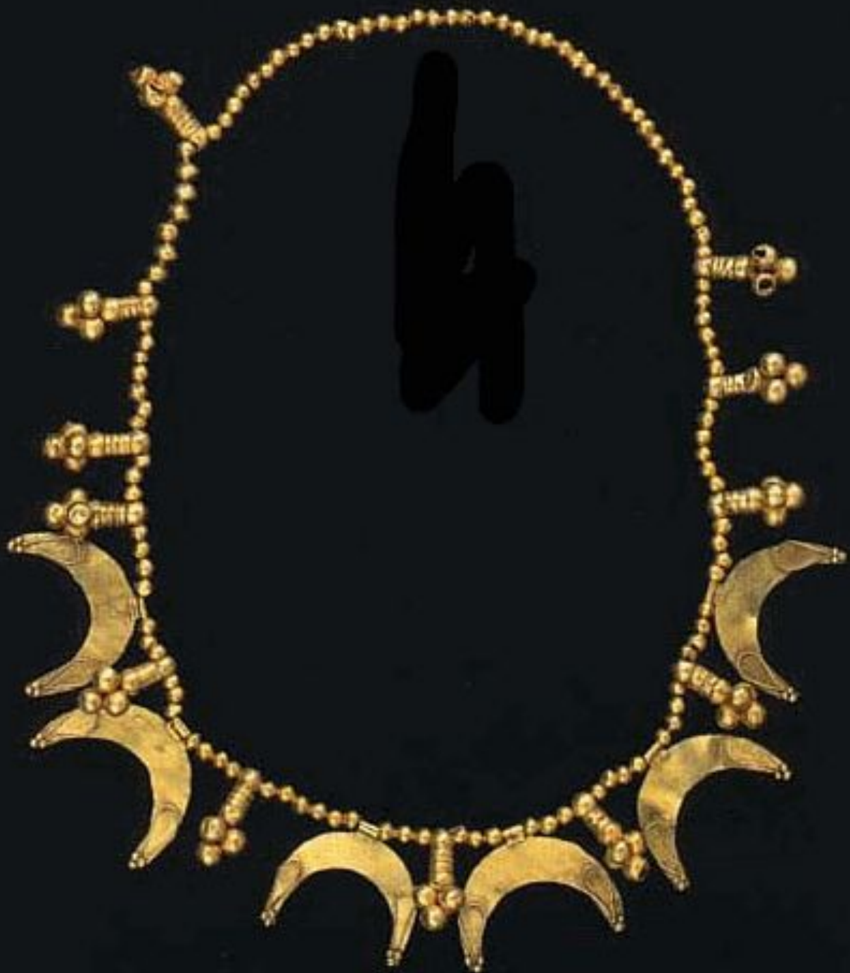
Ожерелье V в. до н.э. Золото Длина - 475 мм Курган возле с. Волковцы Сумской обл. Раскопки И.А. Линниченко, 1898