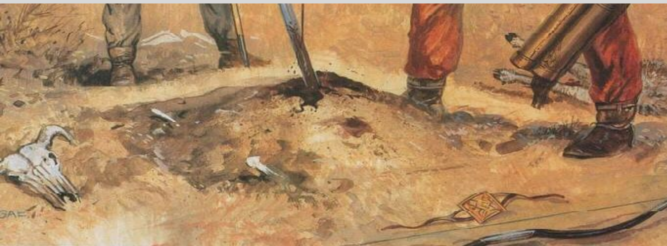
Сарматы, Аорсы, Роксаланы I - III веков н.э. Знать, Воины. Реконструкции.

Скифы сочетали в себе удивительную с точки зрения современного человека жестокость и не менее удивительную любовь к предметам роскоши.