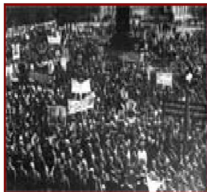
Слава освободителям Бежицы! Митинг 20 сентября 1943 г.

19 сентября 1943 г. по решению ЦК ВКП(б) в г. Орле, впервые в нашей стране, был проведён парад представителей партизан. Это был своеобразный рапорт ЦК ВКП(б) и Советскому правительству о боевых делах народных мстителей Брянских лесов. На следующий день митинг воинов, партизан и жителей города состоялся в освобождённой Бежице.