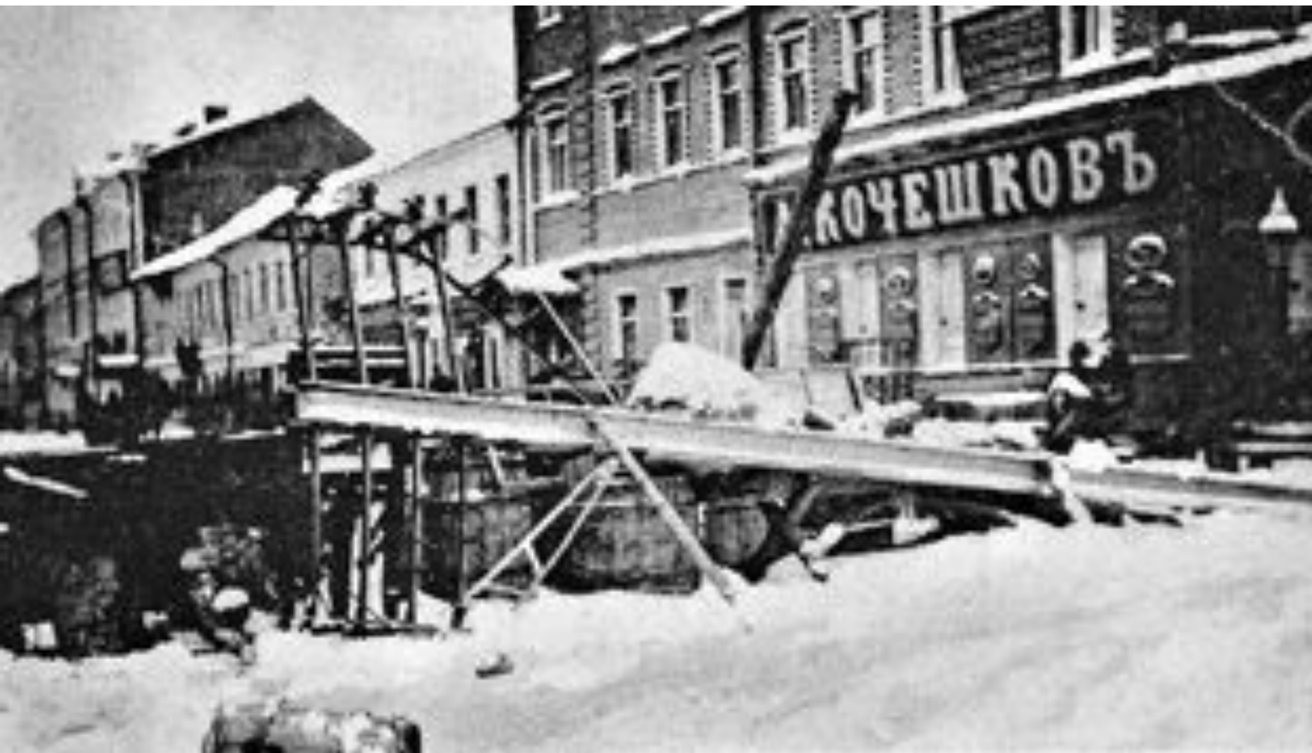
Баррикады на улицах Москвы