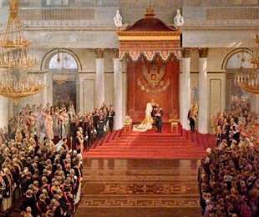
Торжественное открытие Первой государственной думы