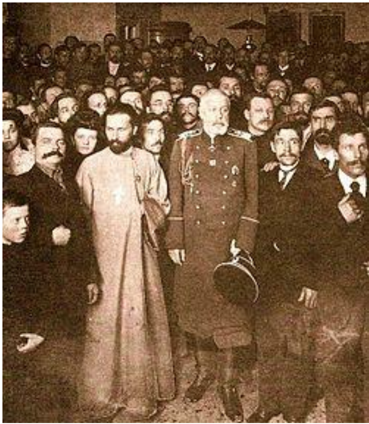
Г. А. Гапон в «Собрании русских фабрично-заводских рабочих».