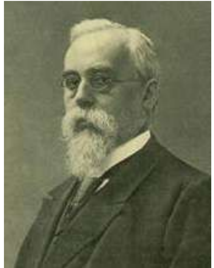
Сергей Андреевич Муромцев

9 июля 1906 г. царь распустил I Государственную думу.