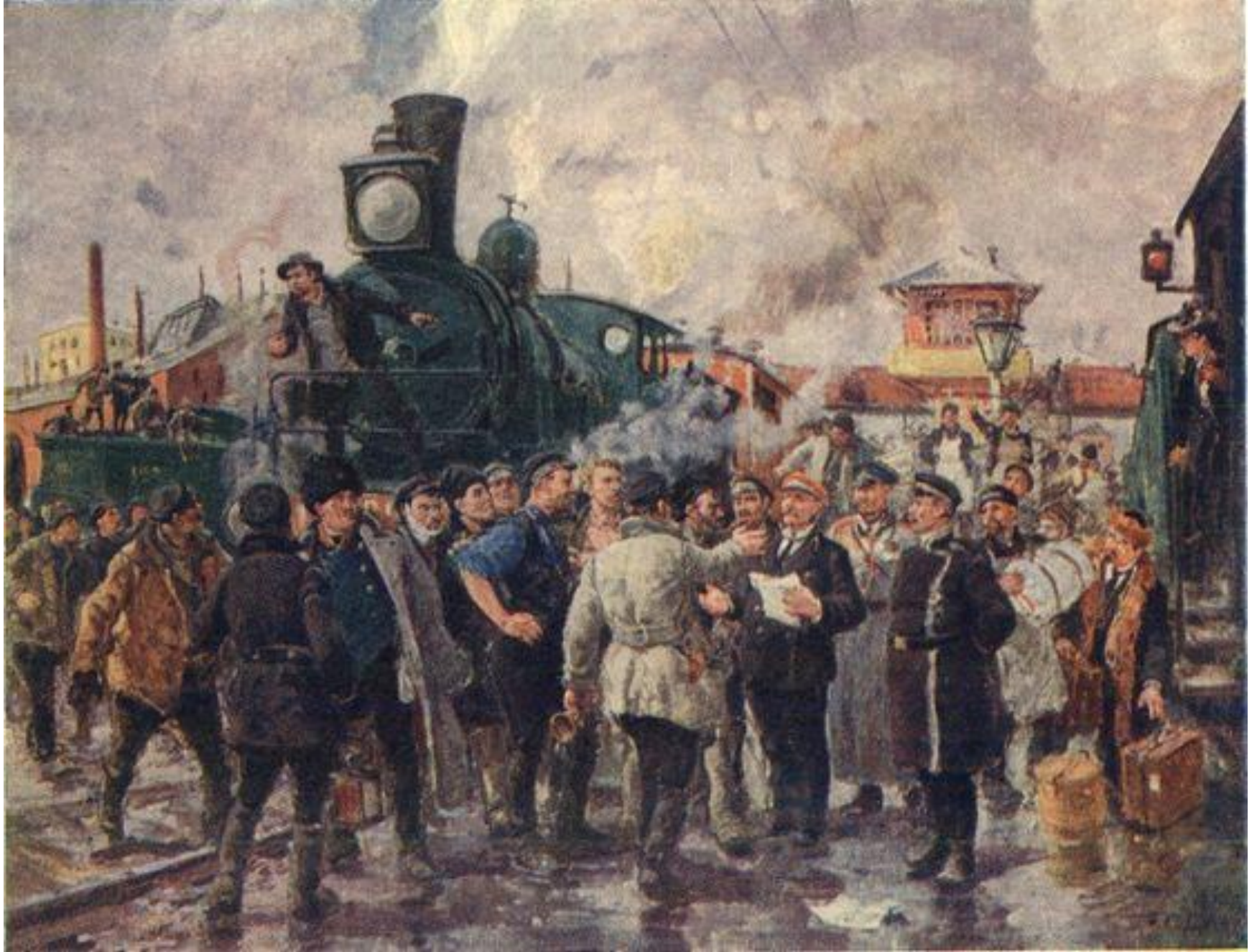
7 октября 1905 г. – забастовка ж/д рабочих