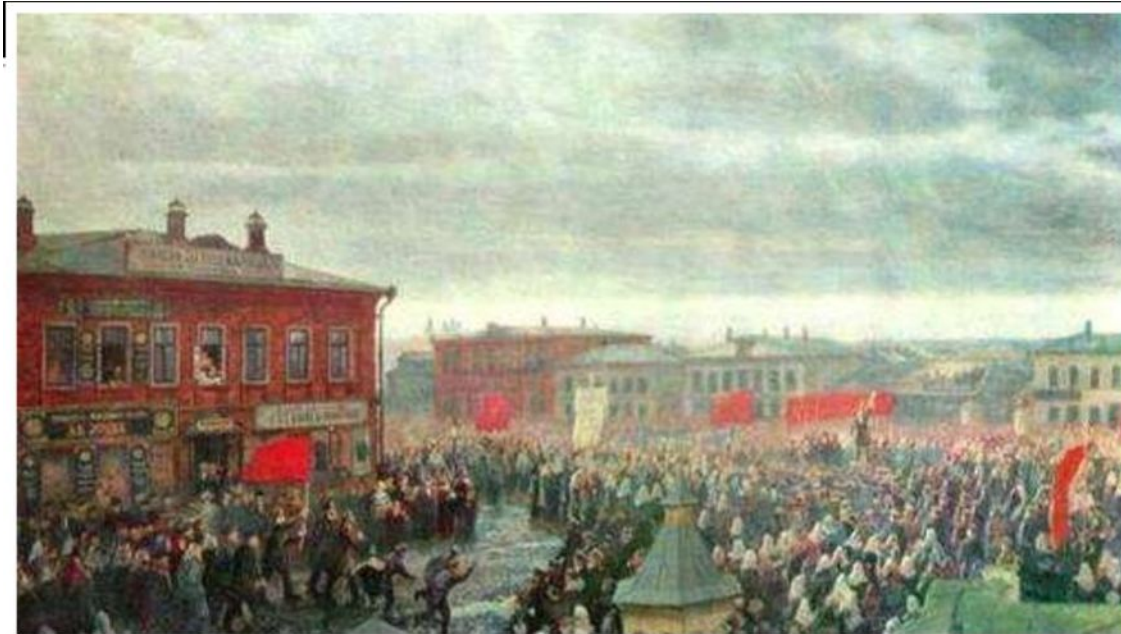
Стачка ткачей в Иваново – Вознесенске, продолжавшаяся 72 дня. В ней участвовало 70 тыс. рабочих.

Рабочие взяли власть в свои руки и организовали для управления городом Совет. Он образовал рабочие дружины и кассы взаимопомощи, заставил предпринимателей повысить зарплату и пойти на другие уступки.