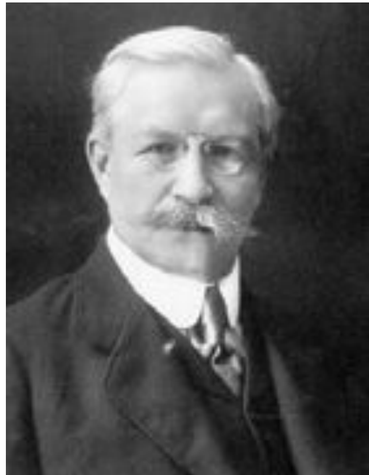
Павел Николаевич Милюков

Численность в 1905 – 1906 гг. – от 50 до 100 тыс. человек.