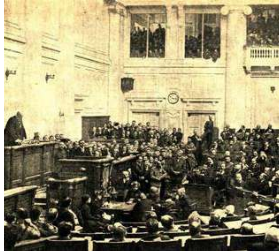
Заседание Государственной Думы