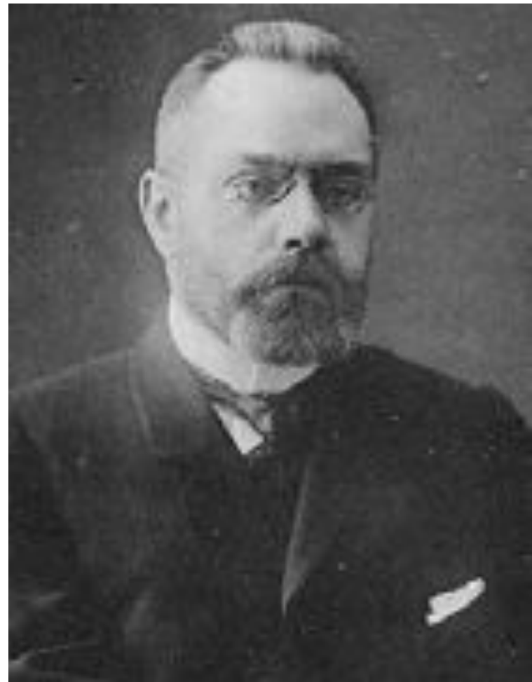
Александр Иванович Гучков

Численность партии в 1906 г. – 75 – 77 тыс. человек.