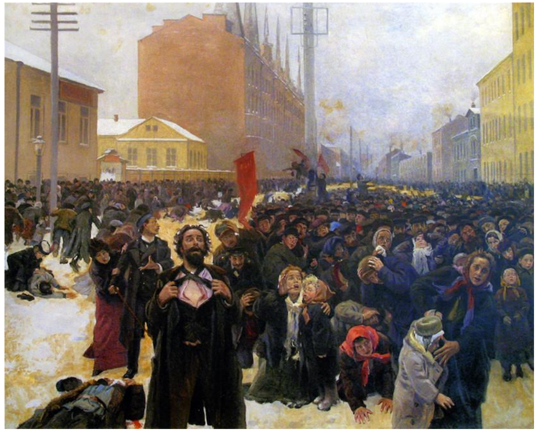
9 января 1905 г. на Васильевском остров. Художник В. Е. Маковский