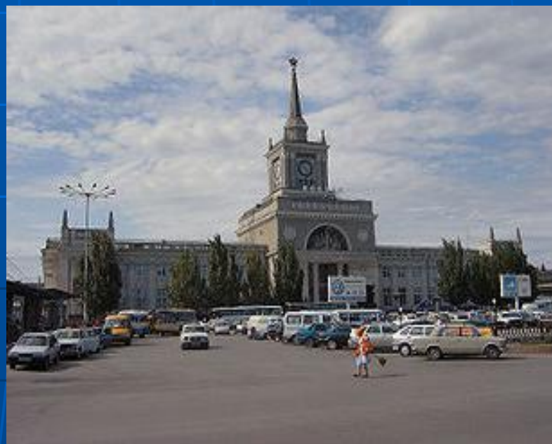
Вокзал на станции Волгоград-I