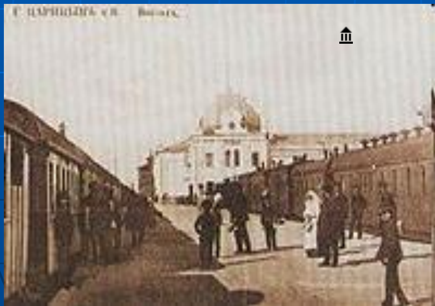
Перрон на станции «Царицын»

Волгоград I — железнодорожная станция Волгоградского отделения Приволжской железной дороги, центральный вокзал Волгограда. Расположен на территории Центрального района по адресу: Привокзальная площадь, 1. Обслуживает как пригородные поезда, так и поезда дальнего следования. Станция является узлом пяти направлений: на Краснодар, Ростов-на-Дону, Москву, Саратов и Астрахань