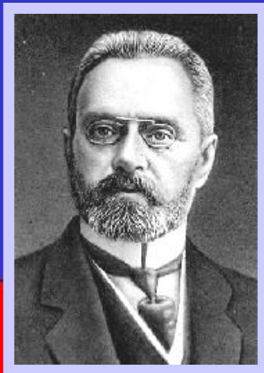
П.Н.Миллюков и А.И.Гучков

Кадеты опирались в основном на интеллигенцию. В это же время возник «Союз 17 октября» (А.И.Гучков). Октябристы добивались единства России, неприкосновенности частной собственности, уравнивания крестьян в правах с др. сословиями, наделение их участками за счет продажи государственных земель, ограничение стачек и введение рабочего законодательства. Октябристы опирались на крупную буржуазию и поме-