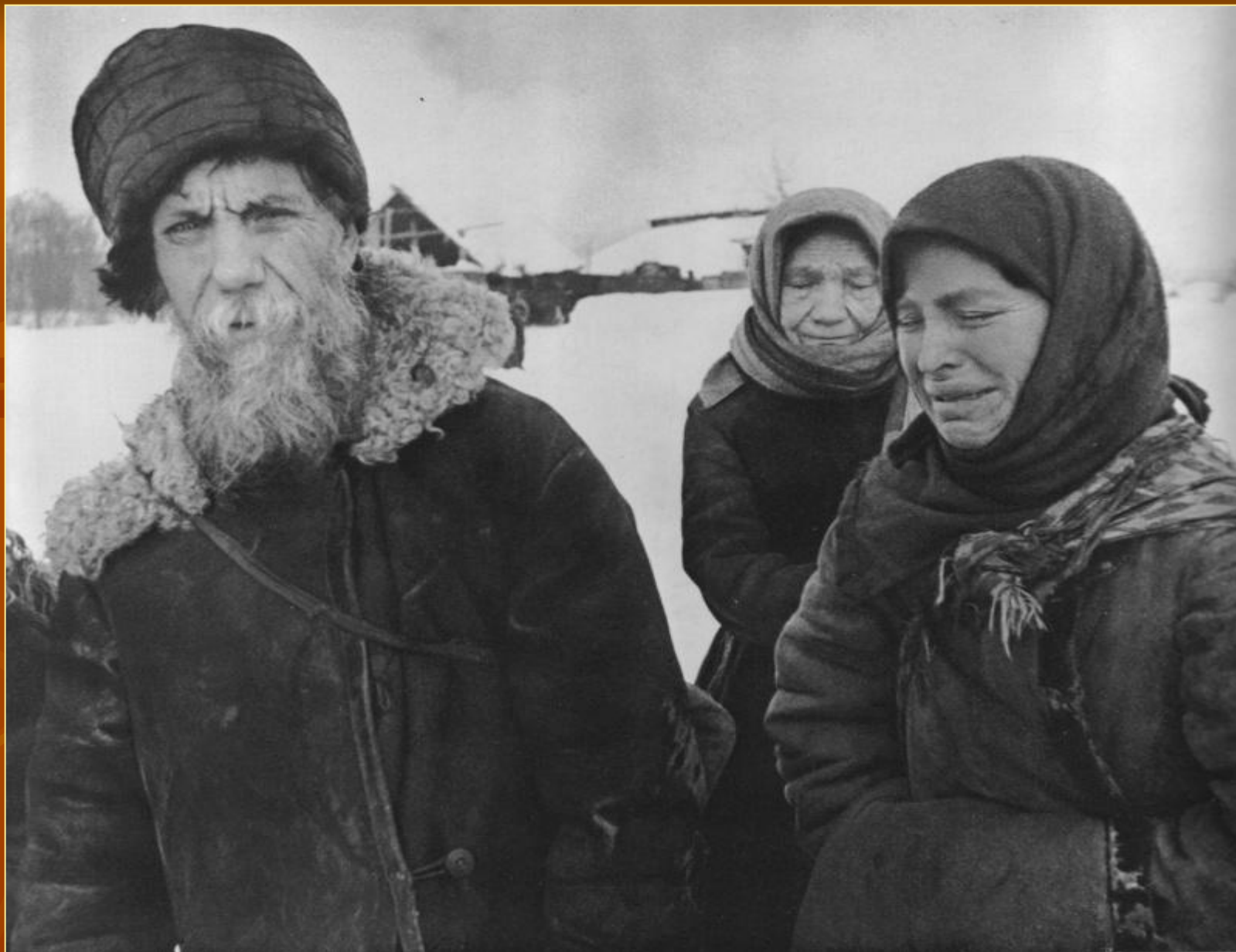
■ Беженцы под Истрой