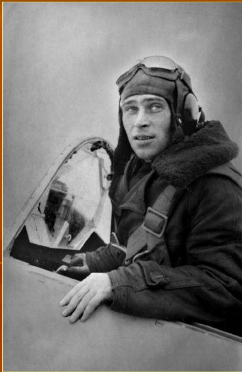
■ Лётчик Виктор Талалихин