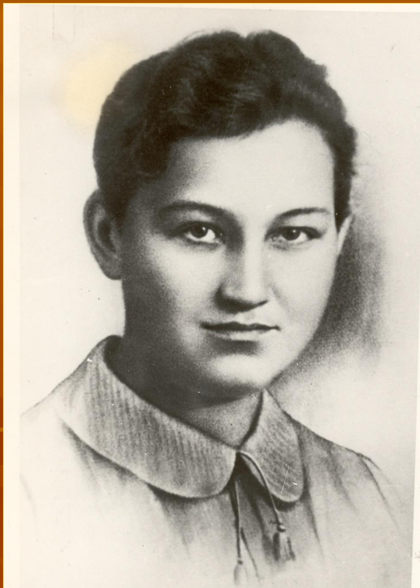
■ Зоя Космодемьянская