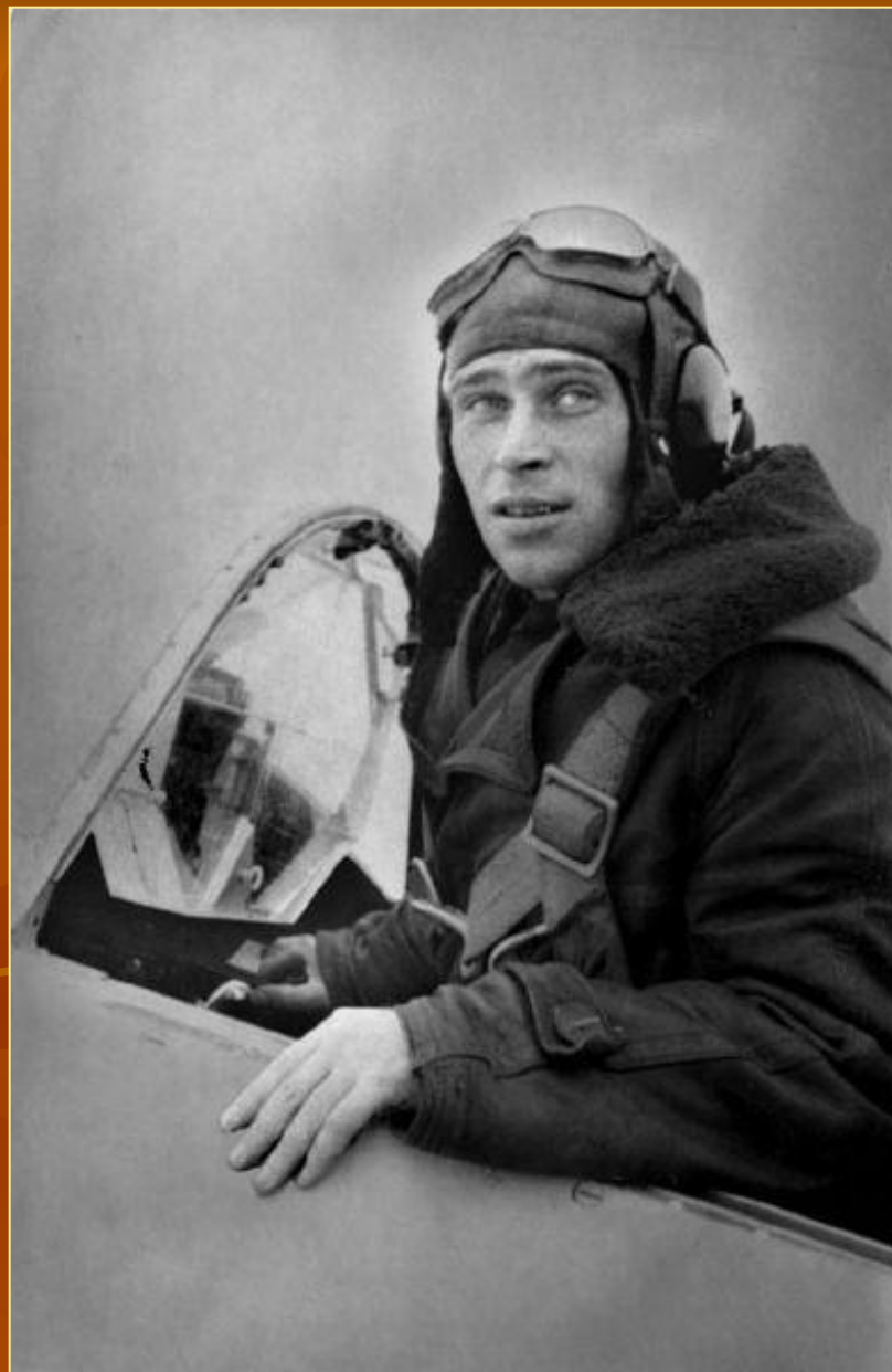
■ Лётчик Виктор Талалихин