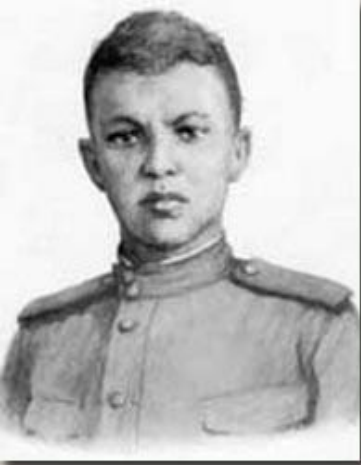
Матросов Александр Матвеевич Стрелок- автоматчик, Герои Советского Союза