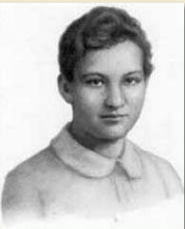
Космодемьянск ая Зоя Анатольевна Партизанка, Герой Советского Союза