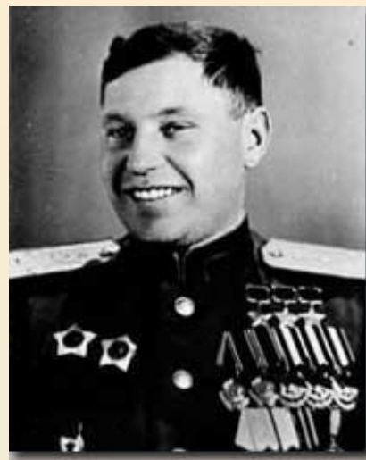
Покрышкин Александр Иванович Трижды Герои Советского Союза, летчик истребитель