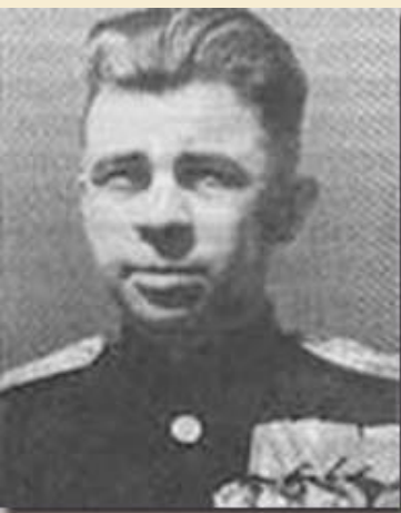
Александр Иванович Маринеско Офицер подводного флота, Герои Советского Союза