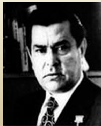
Алексей Петрович Маресьев Летчик, Герои Советского Союза