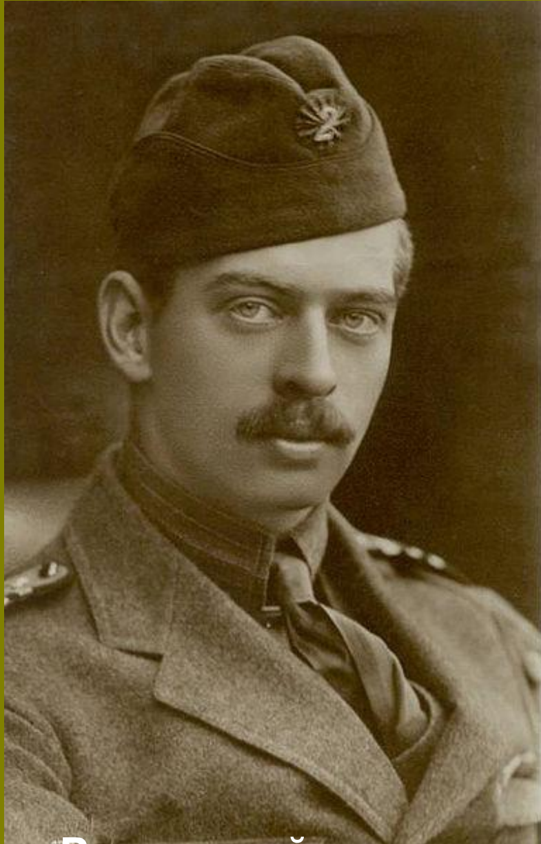
Румынский король Кароль II

После смерти отца Фердинанда в 1927 году Кароль вернулся в Румынию, сместил своего 8-летнего сына Михая I и вступил на престол. В 1938 году установил диктатуру, запретил политические партии и профсоюзы. Лишившись британской поддержки, был вынужден признать Венский арбитраж 1940 года и присоединение Бессарабии к СССР, вскоре после чего был смещён Ионом Антонеску и покинул страну, а королём вновь стал его сын Михай.