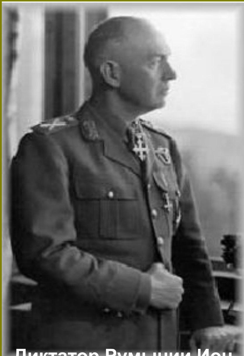
Диктатор Румынии Ион Антонеску

Кароль II в Румынии стал непопулярным королём после значительных территориальных уступок СССР, Венгрии и Болгарии. Этим воспользовалась оппозиция, «Железная гвардия» и Ион Антонеску. В ходе политических споров, 5 сентября 1940 года Кароль вынужден был отречься от престола в пользу своего сына Михая I. При короле Михеае I было сформировано новое правительство, возглавляемое Антонеску.