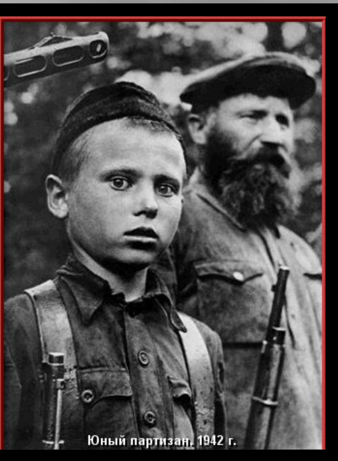
Юный партизан. 1942 г.