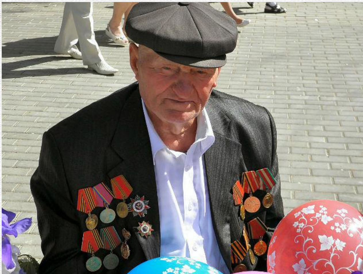
Фото сделано 9 мая 2012 года