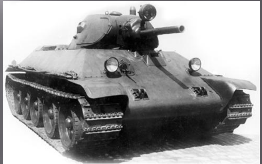
19 декабря 1939 года Комитет обороны при Совете Народных Комиссаров СССР постановлением № 443 принял на вооружение танк Т-34