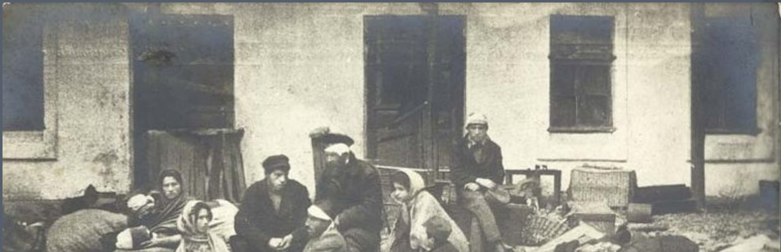
ПОСЛЕ ПОГРОМА ВЪ ОДЕССЕ