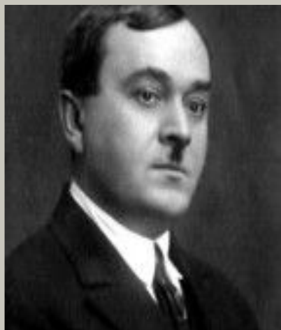
А.В.Александров «Священная Война» (1941)