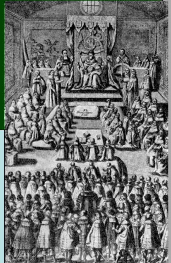
Заседание парламента при Елизавете. Гравюра XVI в.

Выборы: 2 рыцаря от каждого графства, 2 горожанина от каждого города