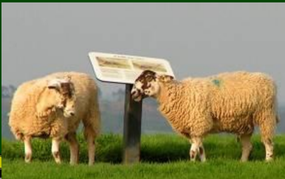
Овцы графства Корнуолл.