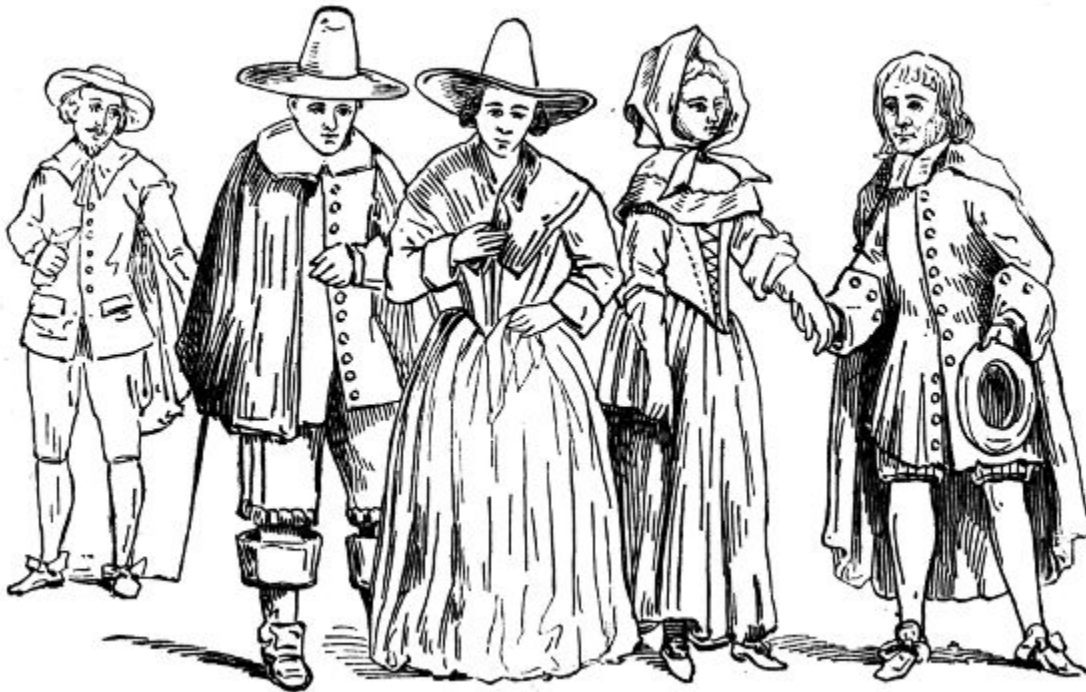
Пуритане, XVII в.