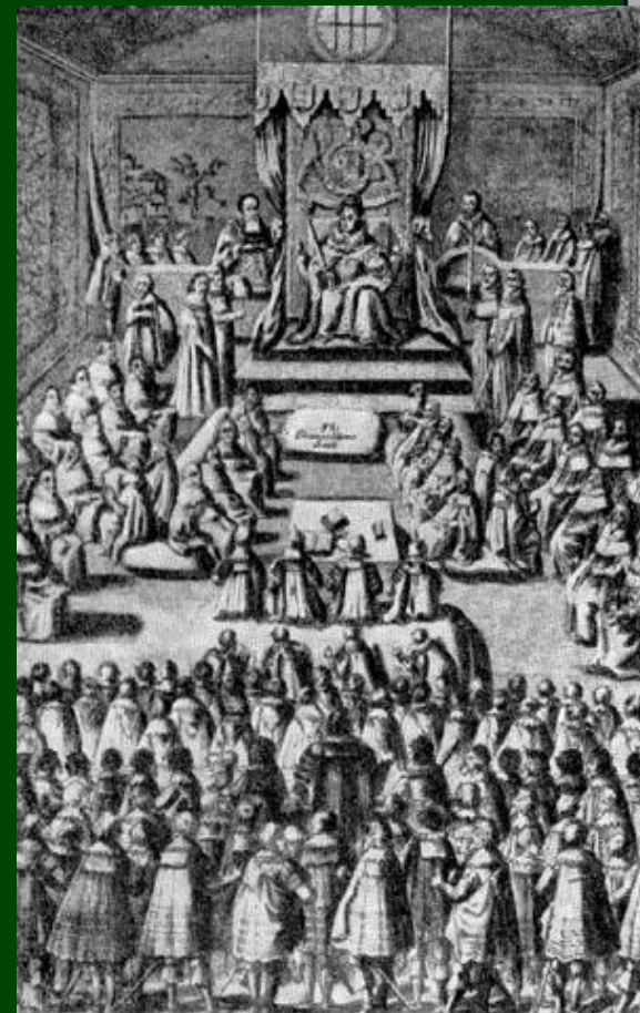
Заседание парламента при Елизавете. Гравюра XVI в.