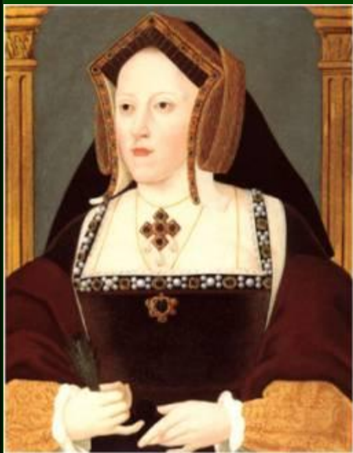
Екатерина Арагонская и Анна Болейн, жены Генриха VIII

От Екатерины Арагонской у Генриха VIII была только дочь Мария. В надежде получить сына, он решил развестись и жениться на Анне Болейн. Папа Римский отказал. Тогда в 1534 году в Англии был принят Акт о супрематии , который провозгласил короля Англии главой английской церкви.