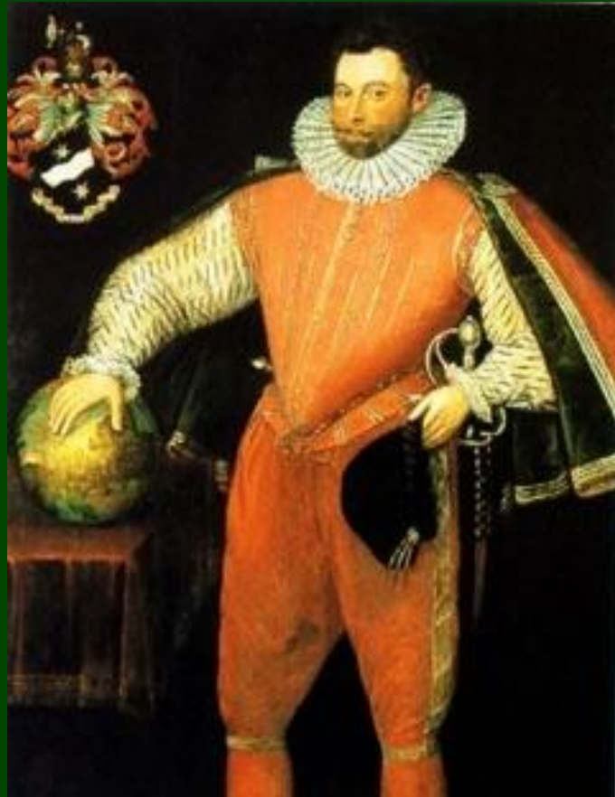
Френсис Дрейк, пират и адмирал и его флагман «Золотая Лань»