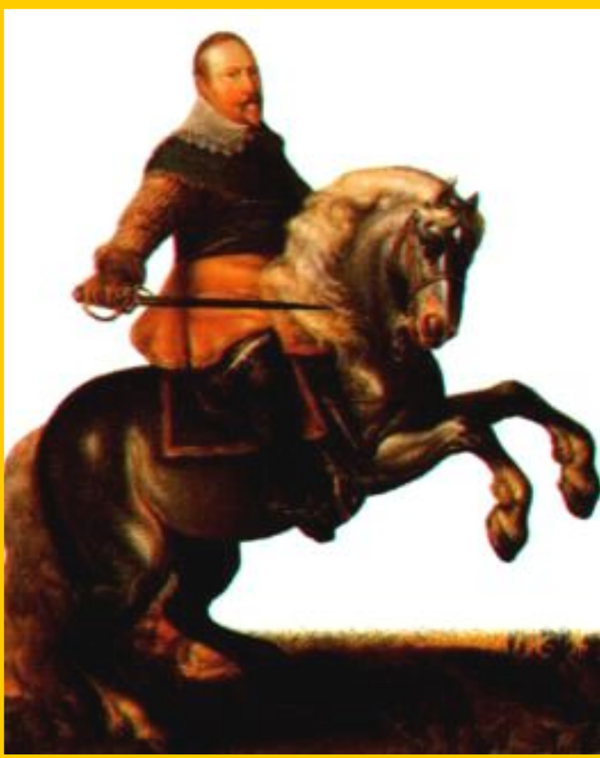
Шведский король Густав Адольф II.

В ответ вспыхнуло восстание. Королем был провозглашен Фридрих Пфальцский- ставленник протестантской лиги. В 1620г. Чехию заняли войска Католической лиги. Протестантов поддержали Швеция, Дания, Франция, Англия, мечтавшие ослабить Габсбургов и присоединить их земли. Во главе католиков встал Альбрехт Валленштейн. Набрал наемников, он разгромил Данию, но был смещен в результате интриг.