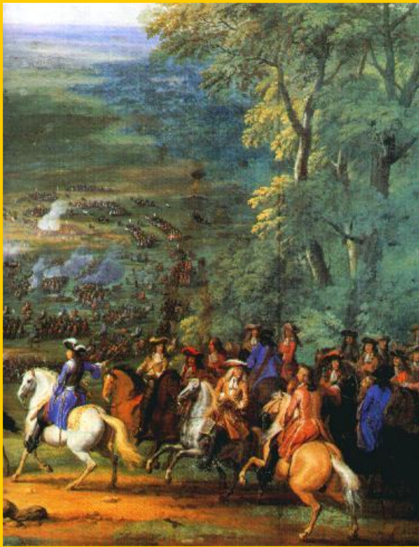
Принц Конде в битве при Рокруа.

Вскоре в Германию вторглись шведы и в 1632 г. Густав Адольф II разбил католиков, но сам погиб. В 1634 г. Валленштейн был убит заговорщиками. Вскоре, в войну вмешалась Франция. Ришелье оказал немецким князьям финансовую помощь. В 1642-46 гг. союзники одержали ряд побед над австрийцами и испанцами, и 24 октября 1648 г. в Мюнстере был подписан Вестфальский мир.