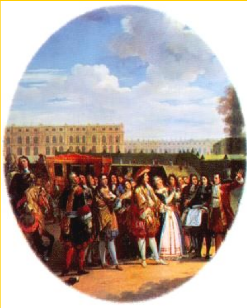
Людовик XIV осматривает Версаль

По окончании войны самыми могущественными государствами стали Швеция и Франция. Французскому королю подражали все европейские монархи. Версаль стал образцом дворцово-паркового зодчества.