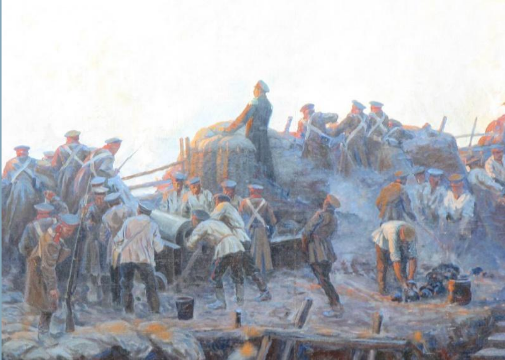
Адмирал Павел Степанович Нахимов на гласисе оборонительной башни Малахова кургана в Севастополе. Фрагмент панорамы «Оборона Севастополя 1854-1855 гг.»