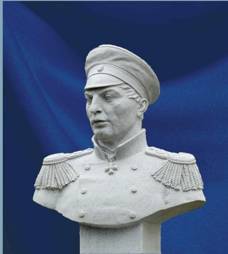
Нахимов Павел Степанович

П.С.Нахимов обладал большими военными дарованиями; отличался смелостью и неординарностью тактических решений, личным мужеством и хладнокровием. В бою стремился максимально избежать потерь. Огромное значение придавал боевой выучке матросов и офицеров.