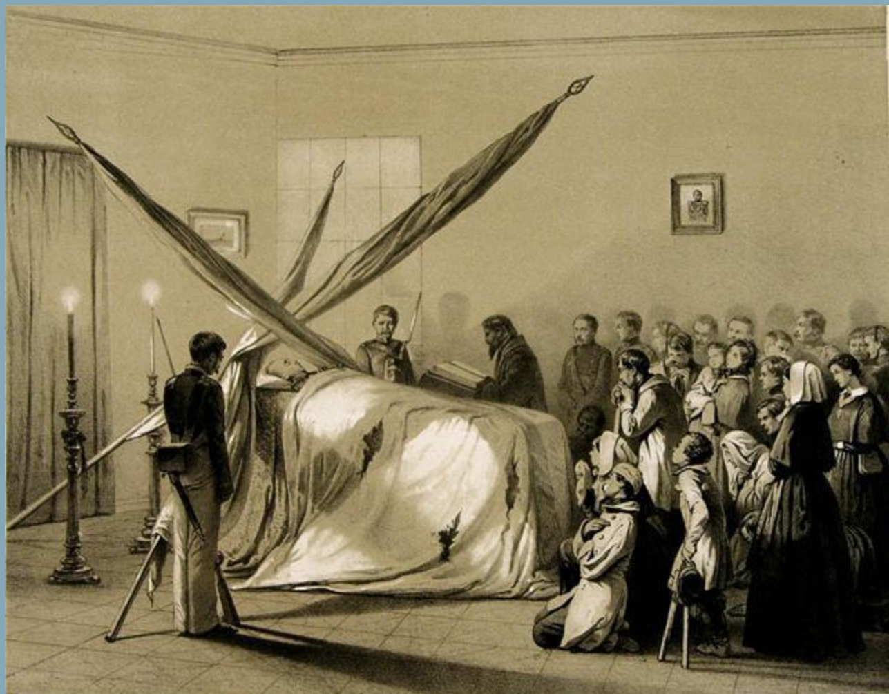
Литография. Тимм В.Ф. с рисунка Н.Берга.

28 июня (10 июля) 1855 Нахимов был смертельно ранен пулей в висок на Корниловском бастионе Малахова кургана. Умер адмирал Нахимов 30 июня (12 июля), не приходя в сознание. Павла Степановича Нахимова похоронили в адмиральской усыпальнице Морского собора Св. Владимира в Севастополе.