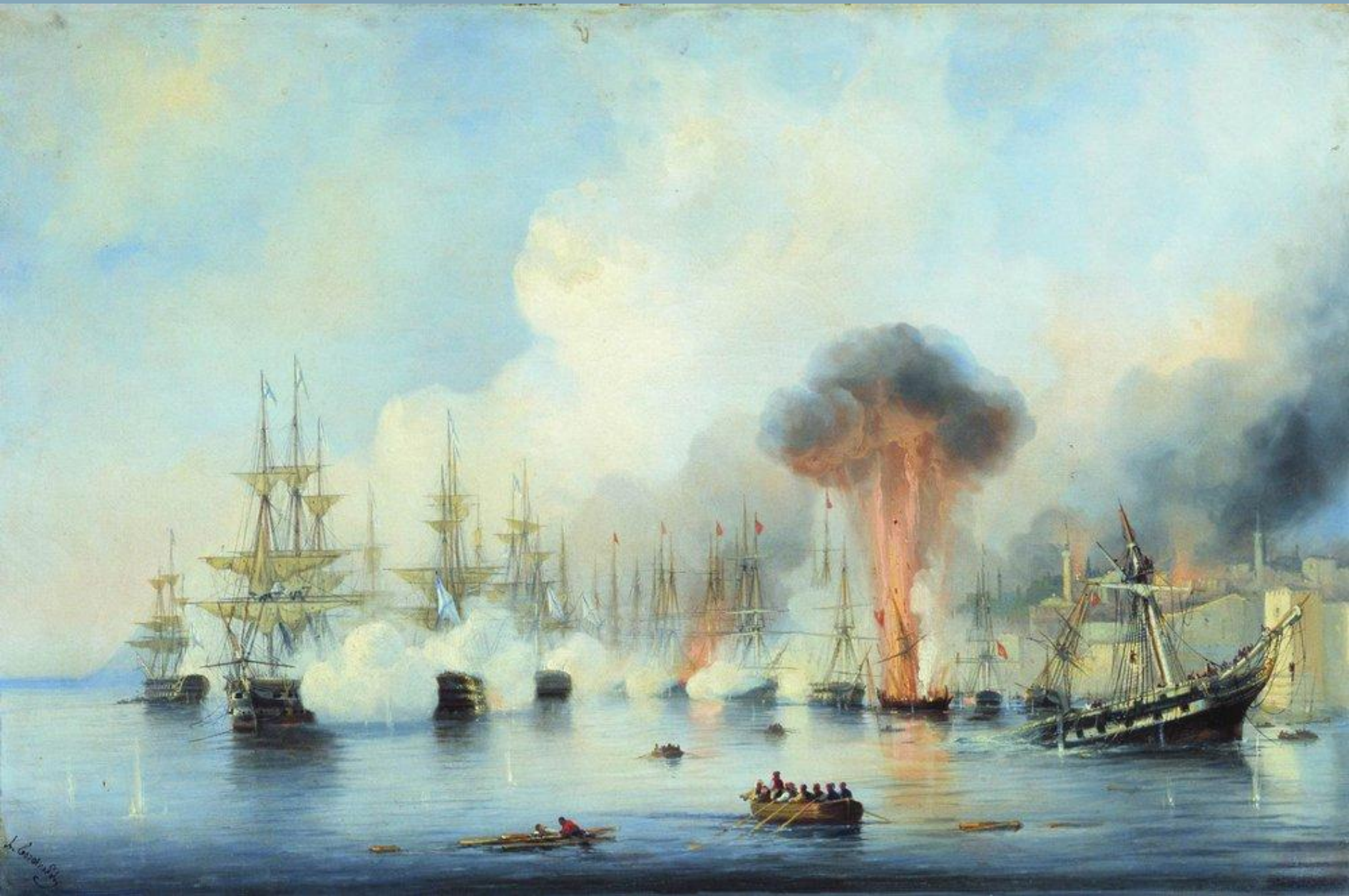
А.Боголюбов. Сражение и истребление турецкой эскадры на Синопском рейде