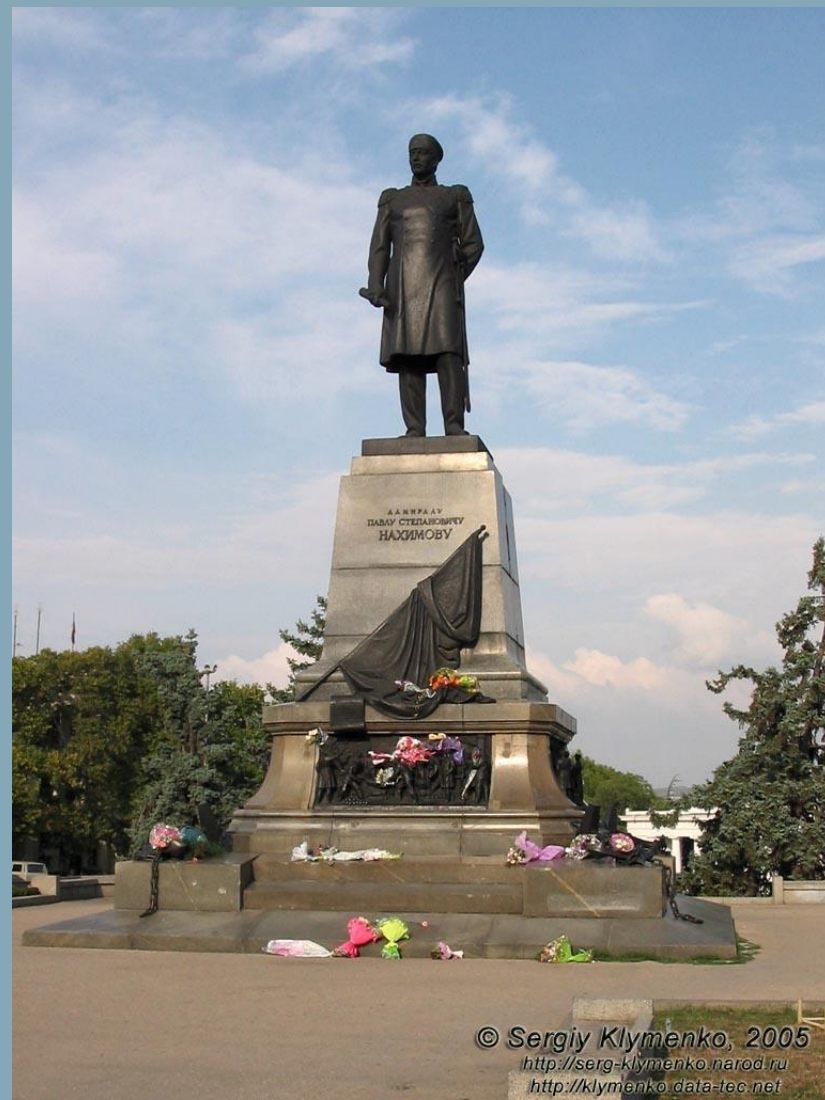
Памятник Нахимову П.С. Севастополь. Поставлен в 1959г.