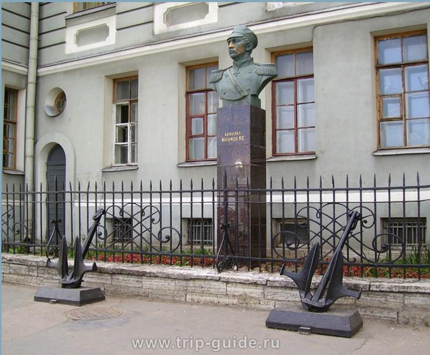
Нахимов П.С. Санкт-Петербург. Здание Нахимовского училища