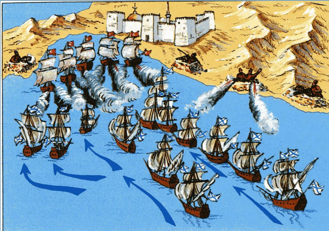
← Манёвры русской эскадры

С началом военных действий в октябре 1853г. Нахимов крейсировал у берегов Малой Азии. Чтобы не дать туркам перебрасывать войска на Кавказ, он решает атаковать турок на их морской базе в Синопской бухте.