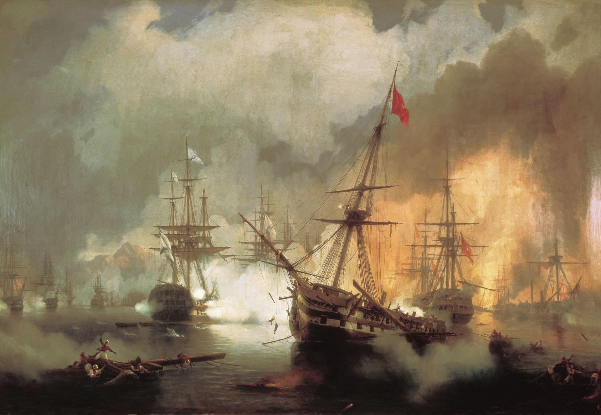
И.Айвазовский. Наваринское сражение