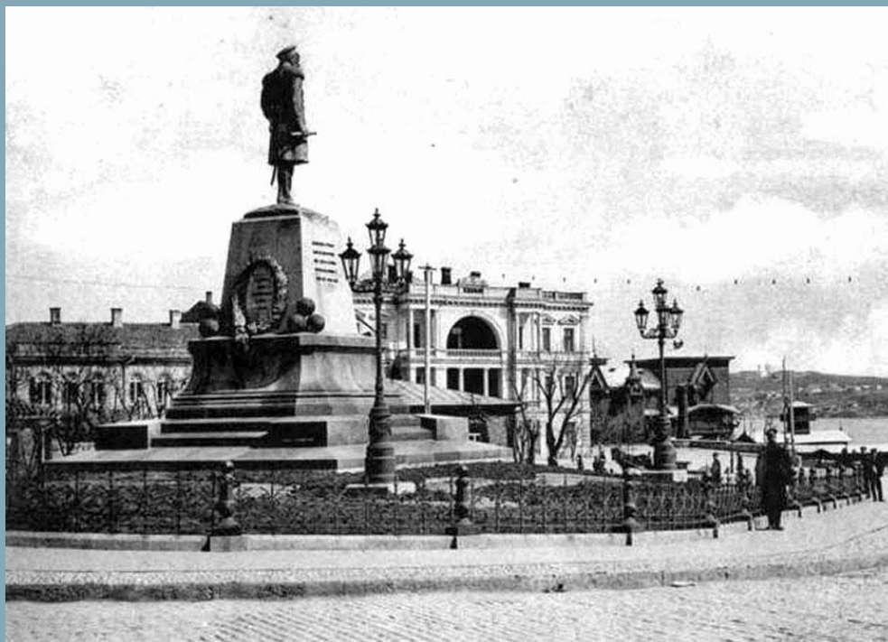
Памятник Нахимову. Севастополь. Поставлен в 1898г. Демонтирован в 1928г.