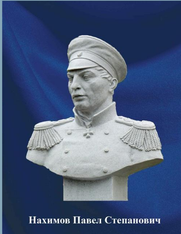
Нахимов Павел Степанович

П.С.Нахимов обладал большими военными дарованиями; отличался смелостью и неординарностью тактических решений, личным мужеством и хладнокровием. В бою стремился максимально избежать потерь. Огромное значение придавал боевой выучке матросов и офицеров.