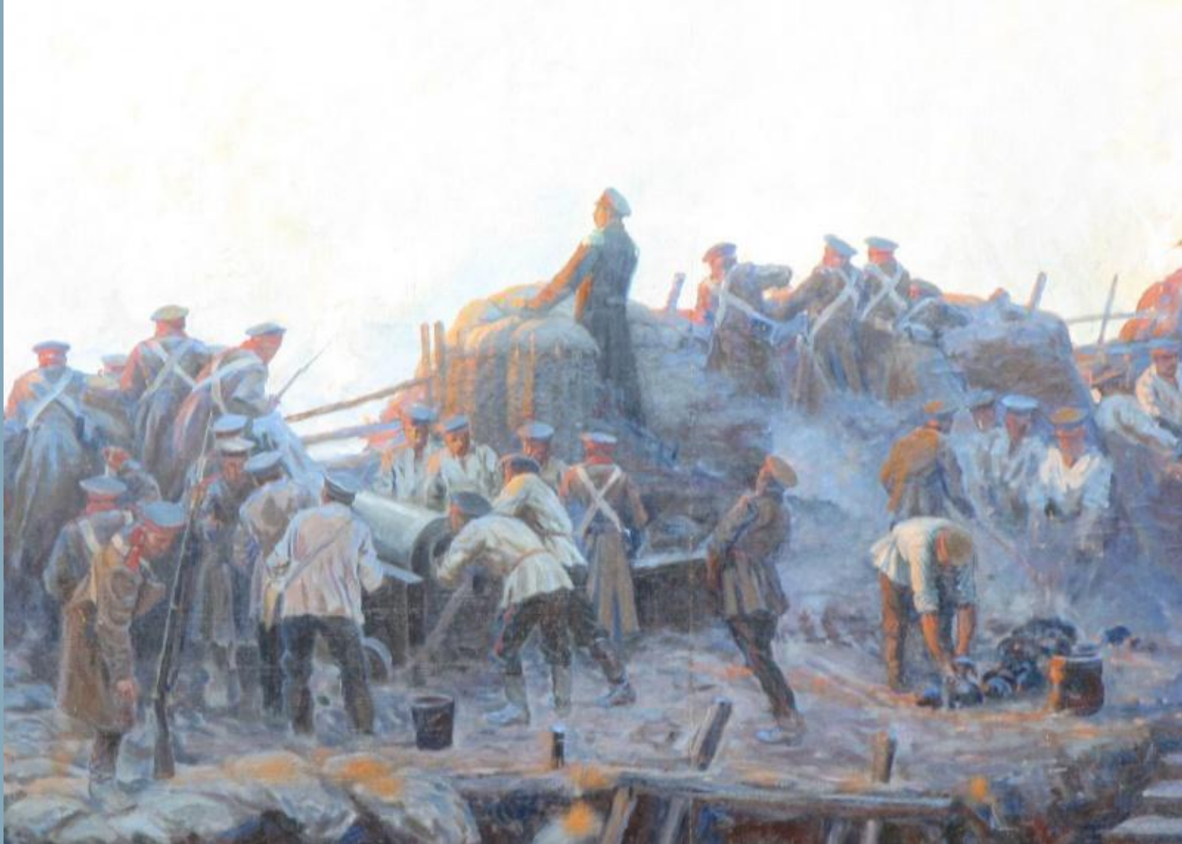
Адмирал Павел Степанович Нахимов на гласисе оборонительной башни Малахова кургана в Севастополе. Фрагмент панорамы «Оборона Севастополя 1854-1855 гг.»