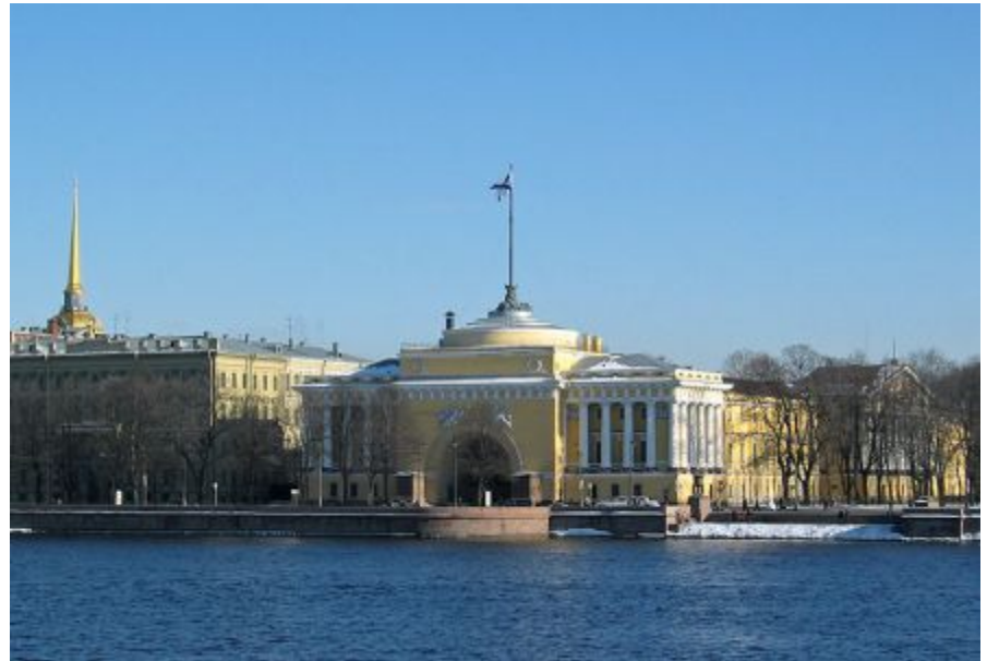
Северный фасад Адмиралтейства