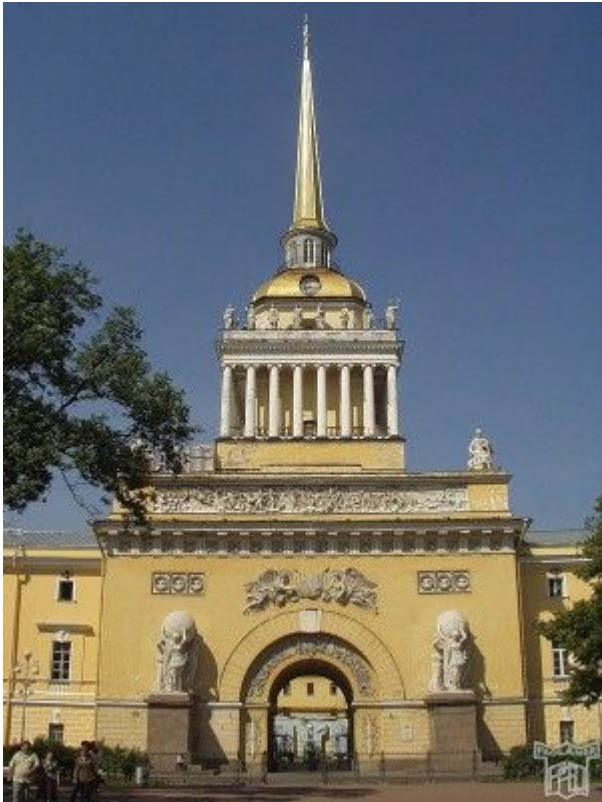
Южный фасад Адмиралтейств а