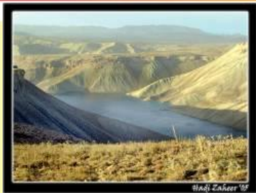
Hadi Zaher '09