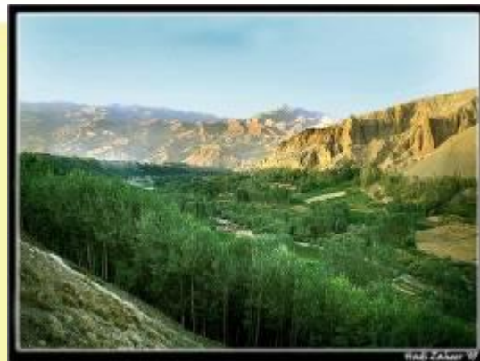
Hadi Zaher '09