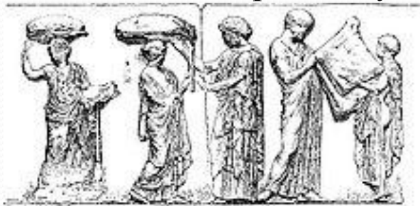
Фриз Парфенона: обряд ткания пеплоса

Панафинеи («всеафинские»), посвящённые сразу всем «направлениям деятельности» Афины. Проводились в Афинах ежегодно в августе. Великие Панафинеи с музыкальными и гимнастическими соревнованиями. Специально к празднику готовились «панафинеийские амфоры».