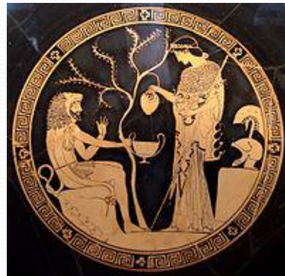
Афина наполняет чашу Геракла вином