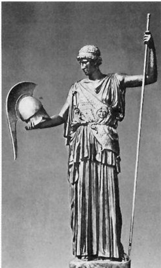
Фидий. Афина Лемния. 450—440 гг. до н. э. Бронза. Staatliche Museum, Дрезден

На данном слайде приведены статуи, имеющие значение для истории искусства