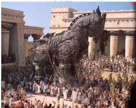
Одиссей и Троянский конь