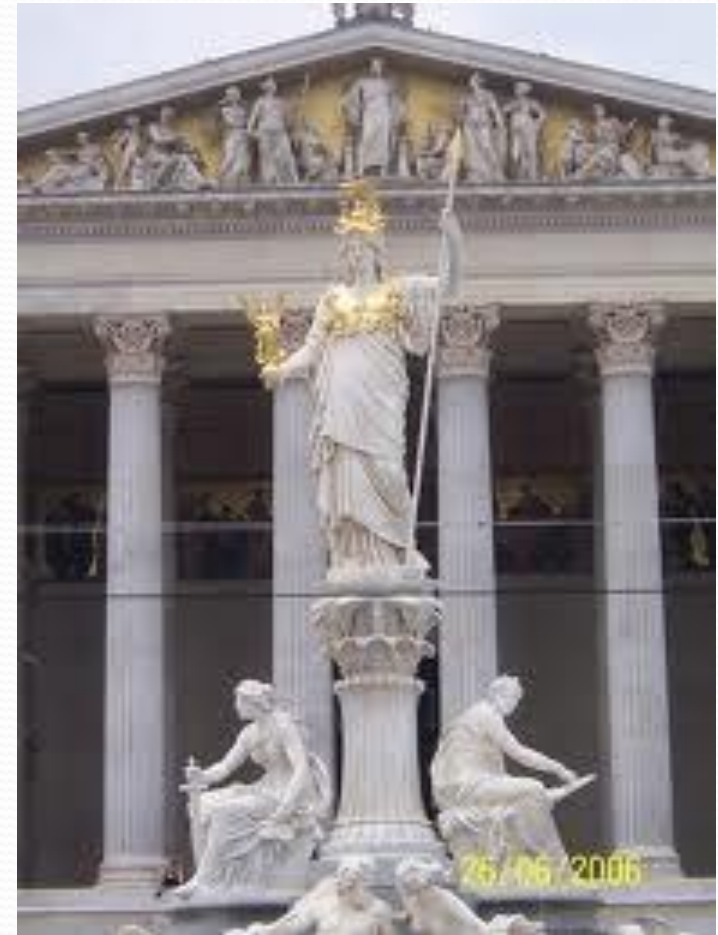
Афина-Паллада возле Парламента Австрии