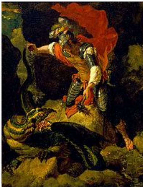
Ясон убивает дракона