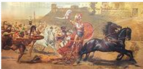
Ахилл с телом Гектора