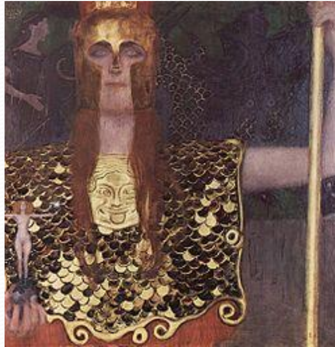
Густав Климт, «Афина Паллада», 1898, Вена