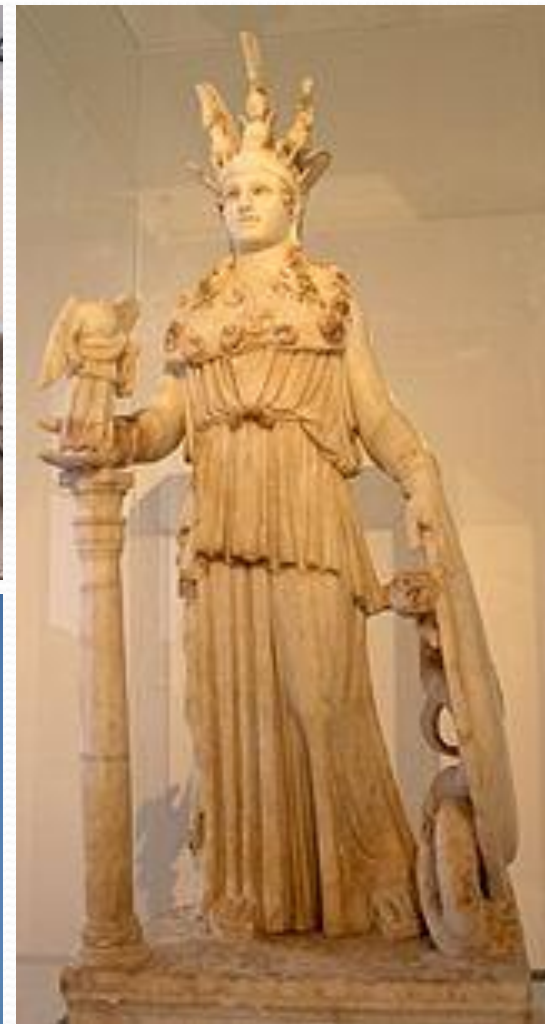
«Афина Варвакион» Копия «Афины Парфенос»)