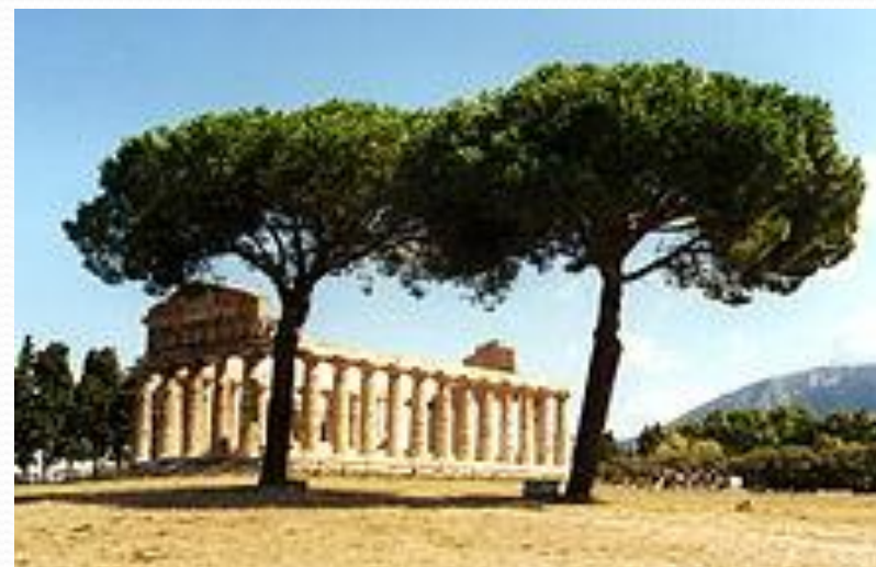
Храм в Пестуме