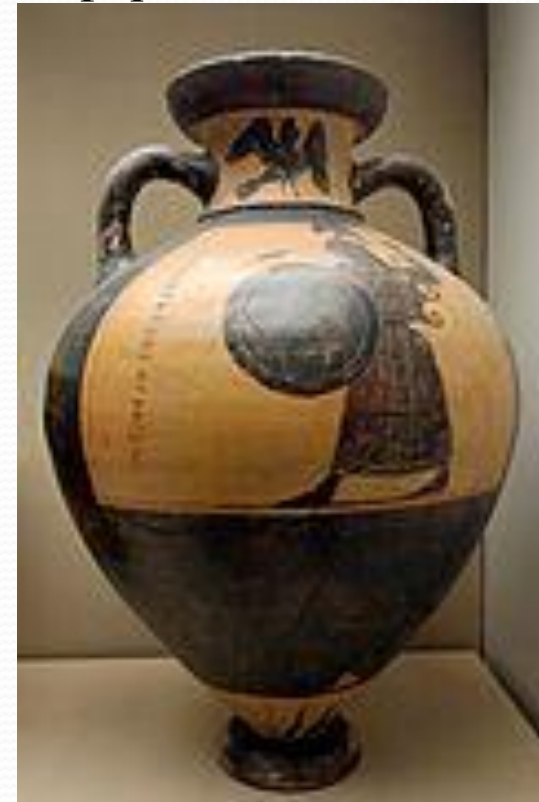
Панафинеийская амфора. Около 560 г. до н. Британский музей. Лондон