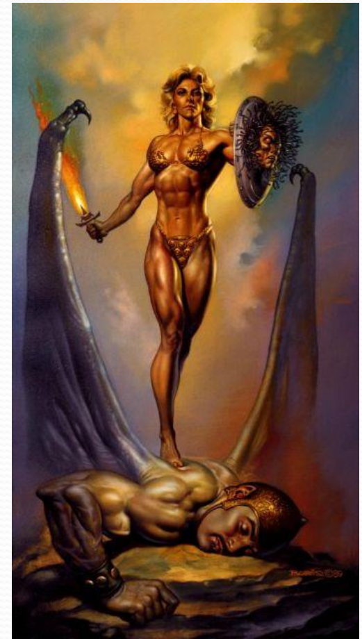
Борис Вальехо «Минерва» 1989