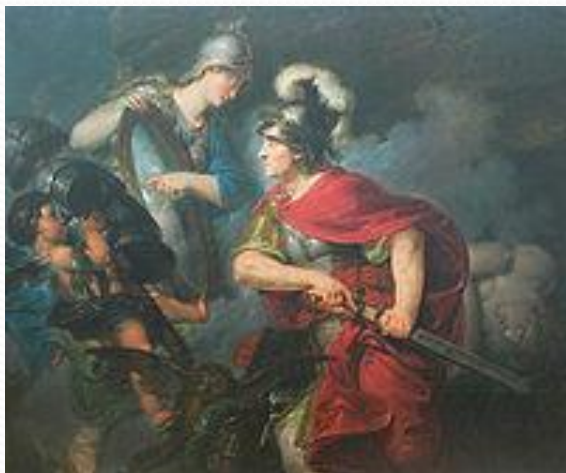
Афина вручает Персею зеркальный

В древнегреческой мифологии крайне подробно освящена тема помощи богини различным героям. Именно она помогает большинству из них в совершении их подвигов.