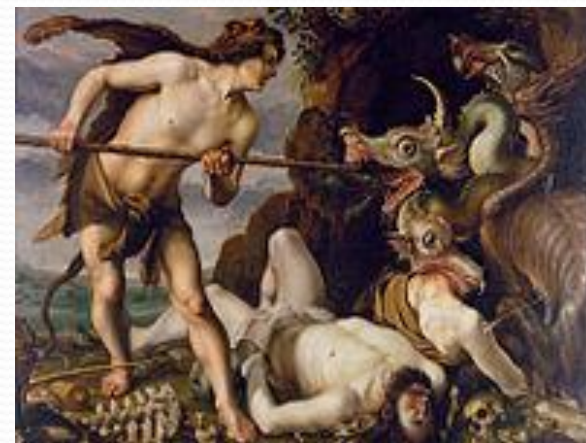
Кадм убивает дракона