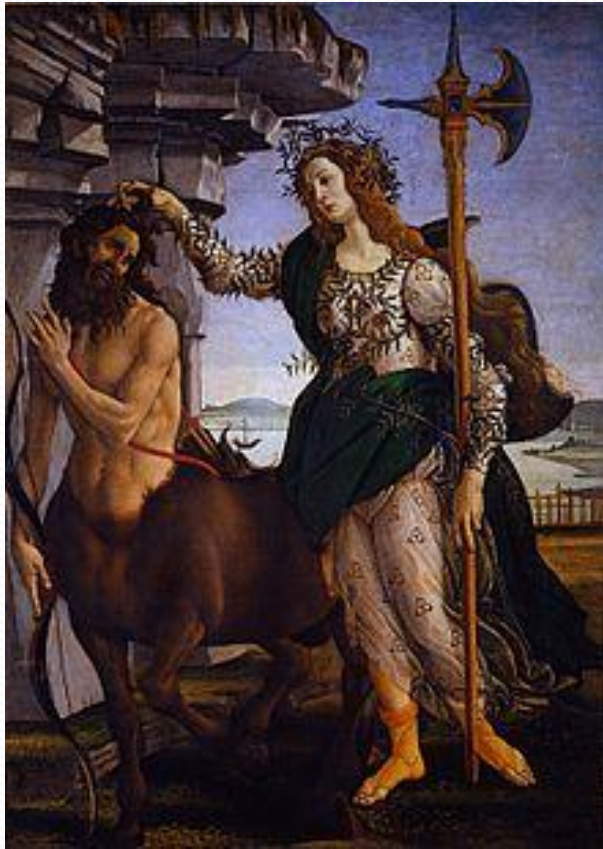
«Паллада и кентавр», картина Сандро Боттичелли, 1482.

В западноевропейской живописи Афина изображалась по преимуществу в произведениях аллегорического характера, многофигурных композициях.