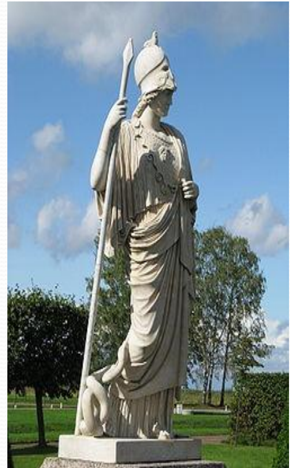
Статуя Афины (тип «Паллада Джустиниани») в садах Петергофа

Афи́на - в древнегреческой мифологии богиня организованной войны, военной стратегии и мудрости, одна из наиболее почитаемых богинь Древней Греции, эпоним города Афины. Кроме того, богиня знаний, искусств и ремёсел; дева-воительница, покровительница городов и государств, наук и ремёсел, ума, сноровки, изобретательности.