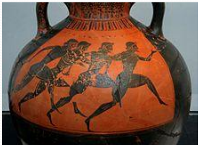
Бегуны-участники Панафинеий Ваза. Около 530 г. до н. э.