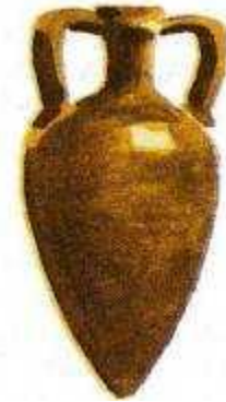
Амфора – сосуд Для вина и масла