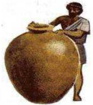
Пифос — глиняная бочка для хранения зерна.