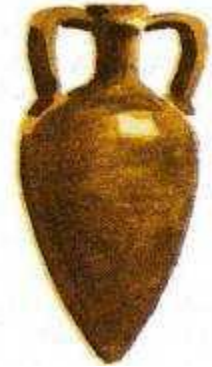
Амфора – сосуд Для вина и масла