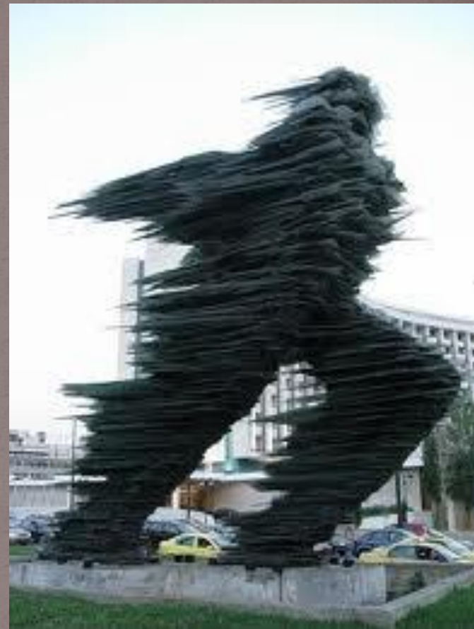
Статуя в г. Афины

Постепенно, из-за скудных условий жизни, количество населения города начало сокращаться. Также подверглись уничтожению здания и памятники культуры.