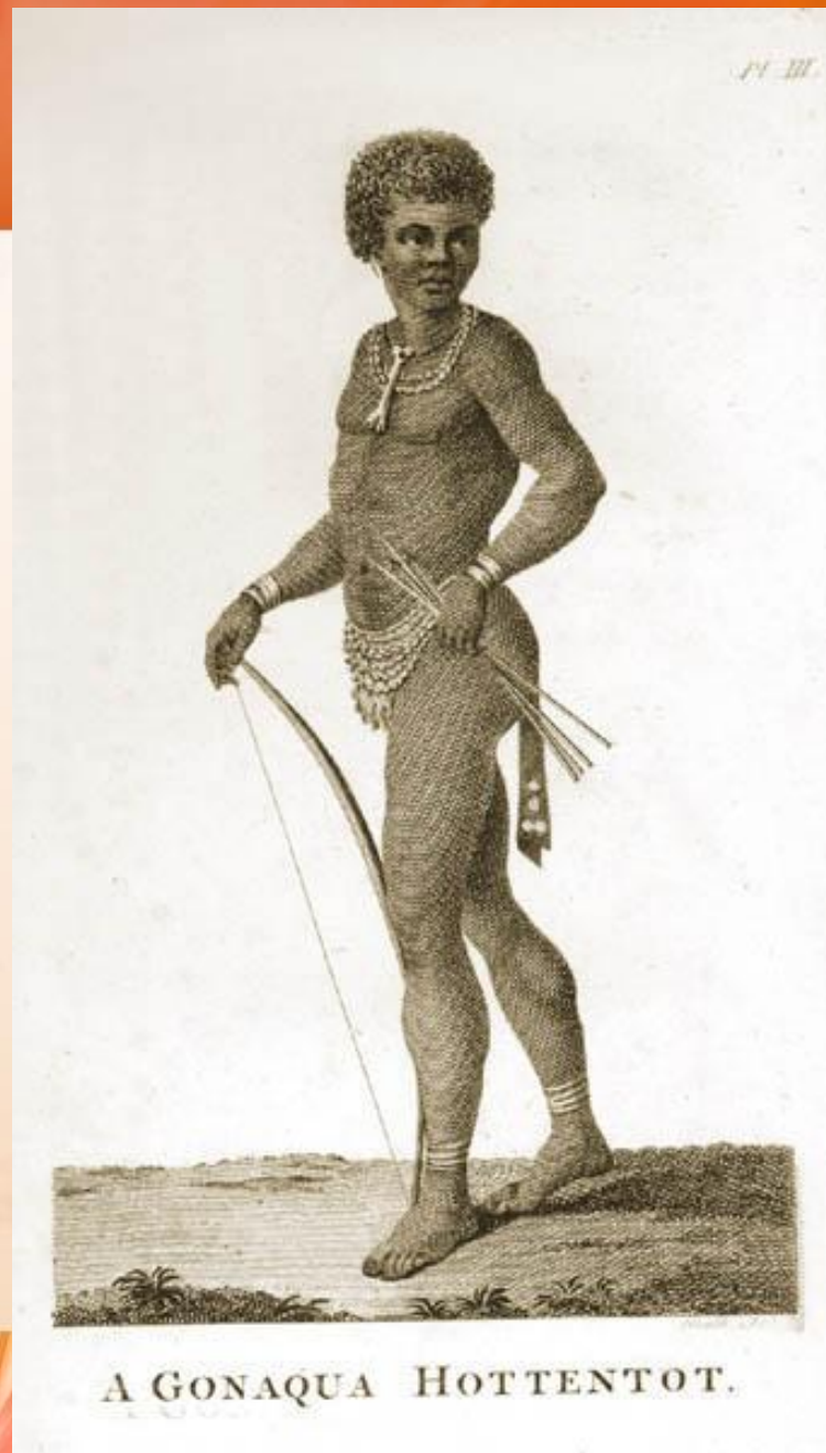
A GONAQUA HOTTENTOT.