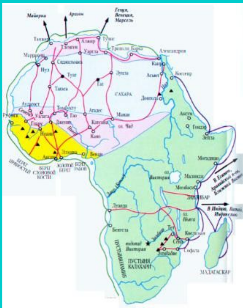
Торговые пути Африки.

На территории Африканского рога в 4-5 веках существовало государство Аксум. Оно торговало с Римом и Византией. Знать Аксума приняла христианство.