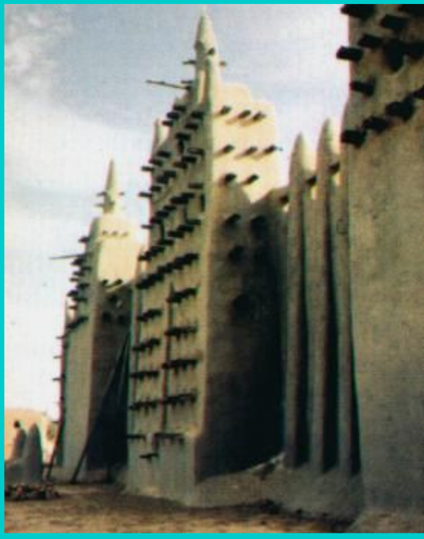
Мечеть в Дженне.

В 15 в. окрепло государство Сонгаи. Али Бер построил мощный речной флот и присоединил Дженне и Томбукту. Приняв ислам, он построил несколько мечетей. В Сонгаи складывались феодальные отношения, но в 16 в. государство ослабло.