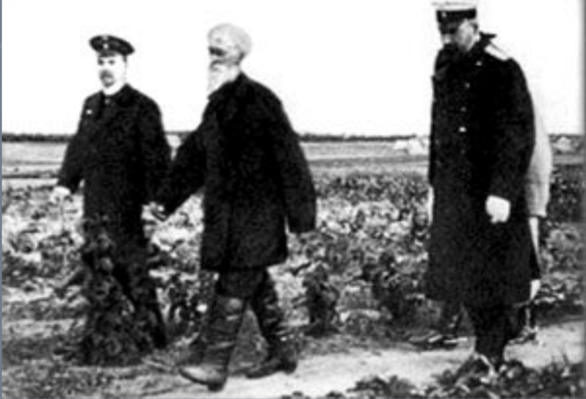
П.А.Столыпин осматривает хуторские огороды близ Москвы в апреле 1910 г.