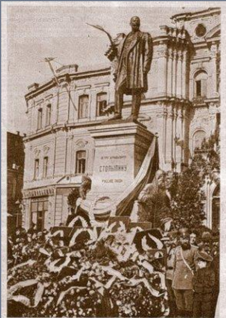
Открытие памятника первому председателю Совета Мануэлю П. А. Столицкому, в г. Киев, 5 октября с. г. Памятник высотой 12 аршин. Председатель совета изъят с рельсов трамвая. Памятник памятника аллегорические фигуры Миса (русская женщина) и Сербия (русская женщина). Памятник воздвигнут на главной улице Киева, Мещанский, против здания городской думы. Все сооружение обошлось в 120 тыс. руб. На открытии памятника съезжались женщины, члены Гос. Совета и Гос. Думы разных политических фракций, многочисленные депутаты и высшие должностные. Через два дня, 7 сентября, состоялось заседание думы в г. Столицком Киев, руб. за памятник украинской женщины П. А. Столицкому.