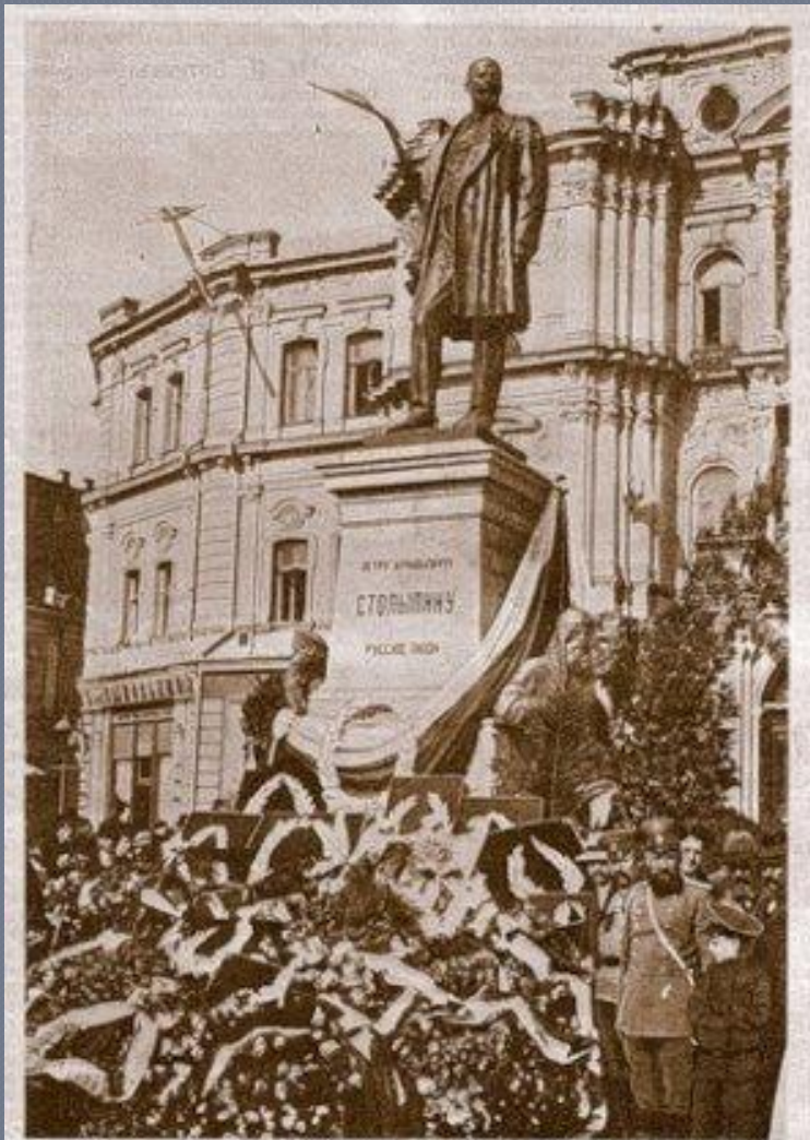
Открытие памятника покойному председателю Совета Министров П. А. Стоятину, в г. Киев, 5 октября с. г. Памятник высотой 12 аршин. Представляет собой изъятие селен-серебряго сплава. Памятник воздвигнут на главной улице Киева, Мещанской, против здания городской думы. Все сооружение обошлось в 120 тыс. руб. На открытии памятника съезжались министры, члены Гос. Совета и Гос. Думы разных политических фракций, многочисленная депутация и высшее духовенство. Через два дня, 7 сентября, состоялось заложение церкви св. Спаса в Киев, руб. за каменья украинской каменщи П. А. Стоятина.

1. Рост сельскохозяйственного производства и улучшение культуры землепользования.