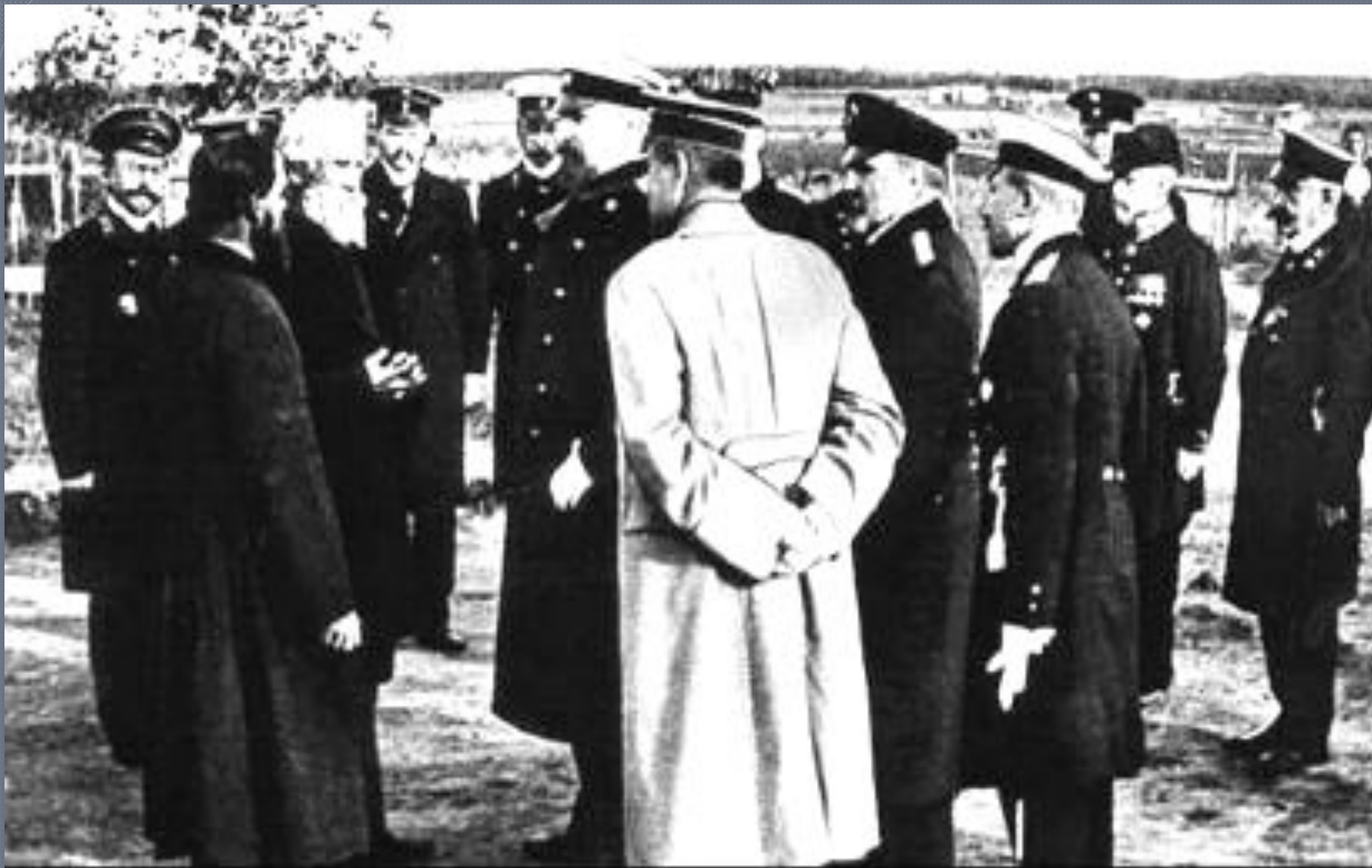
П. А. Столыпин в гостях у кулака.