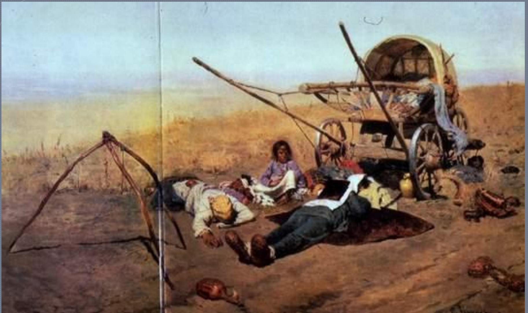
«В дороге...смерть переселенца»