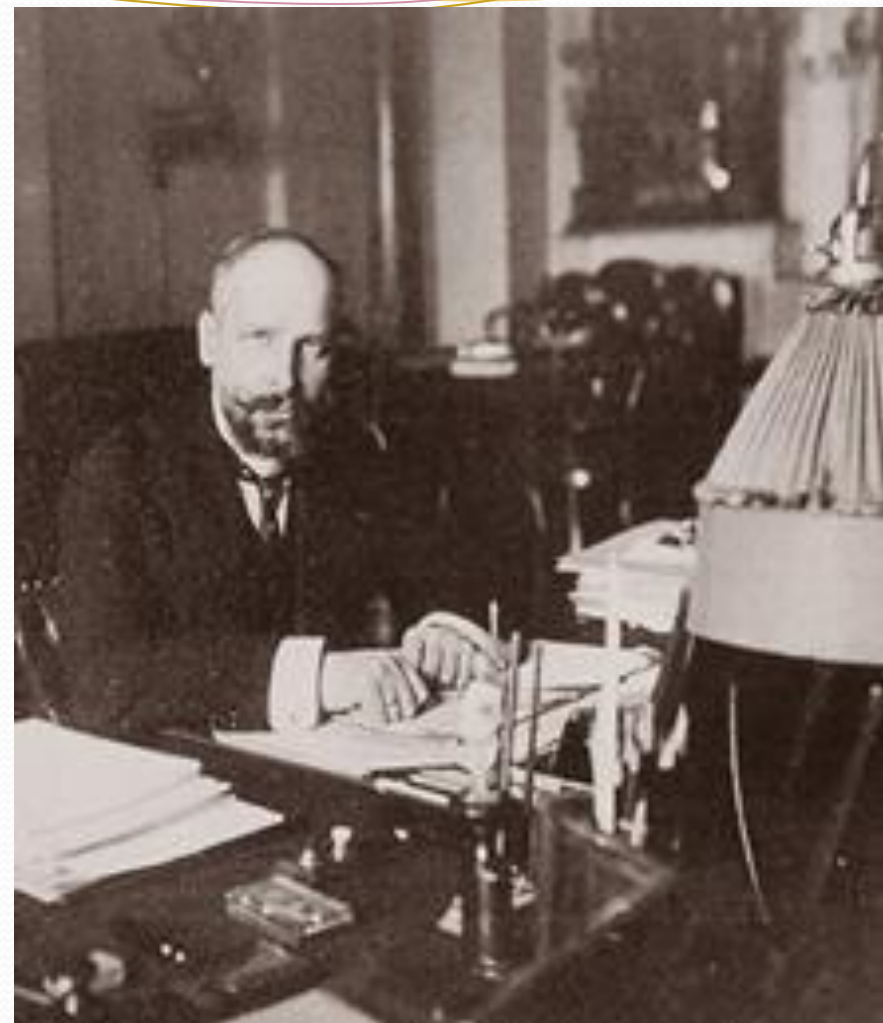
Одна из последних фотографий Столыпина. 1911 г.

Открытие памятника покойному председателю Совета Министровъ П. А. Столыпину, въ г. Киевѣ, 25 сентября с. г. Памятникъ высотой 12 аршинъ. Пьедесталь съдѣланъ изъ свѣтло-серого гранита. По сторонамъ пьедестала аллегорическія фигуры Мещи (русскаго крестьянина) и Солдата (русскаго воина). Памятникъ воздвигнутъ на главной улицѣ Киева, Крещатикѣ, противъ здания городской думы. Все сооруженіе обошлось въ 120 тыс. руб. На открытіи памятника съѣхались министры, члены Гос. Совета и Гос. Думы разныхъ политическихъ фракцій, многочисленная депутація и высшее духовенство. Черезъ два дня, 7 октября, состоялось закладка цѣркви въ с. Столыпинѣ Киевск. губ. въ память армянскаго землемѣра П. А. Столыпина.