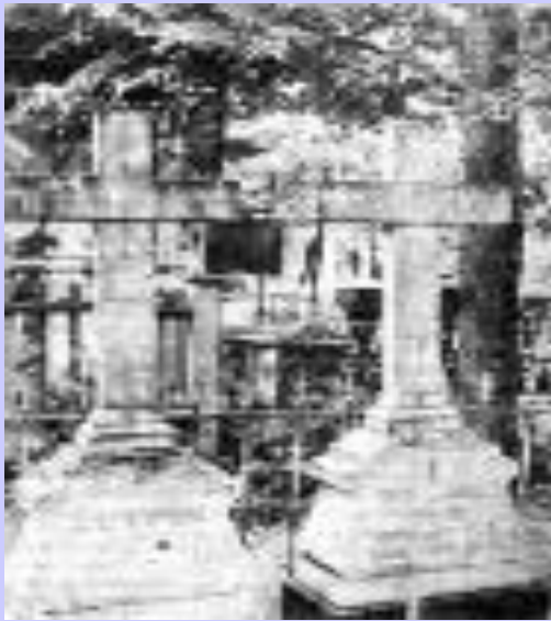
Могила Т.С.и К.С. Аксаковых