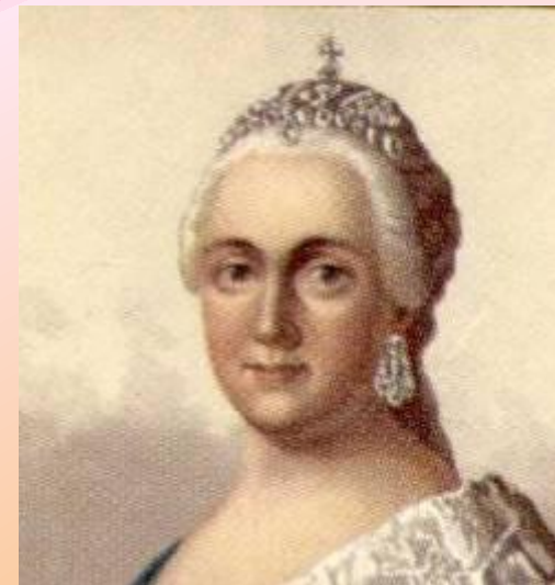
Екатерина II (Великая)

Екатерина II хотела передать престол Александру, минуя Павла.