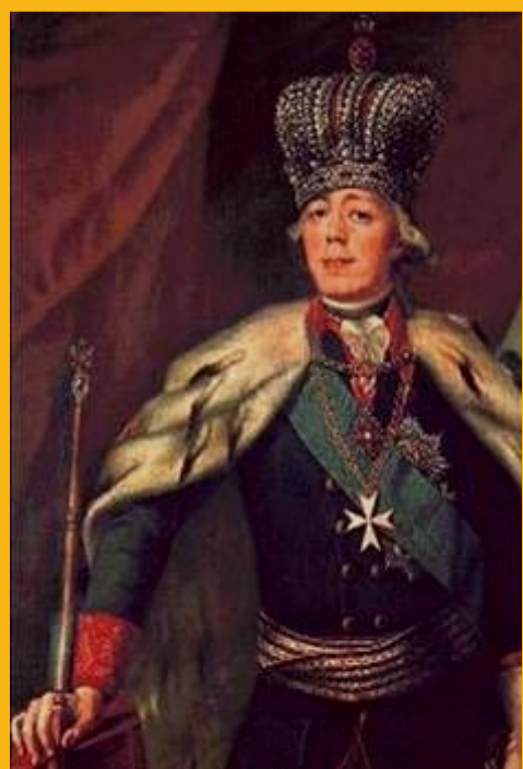
Павел I 1796 - 1801