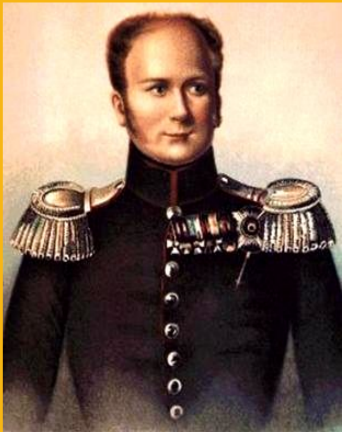
Александр I Император Всероссийский Александра(1801-1825)