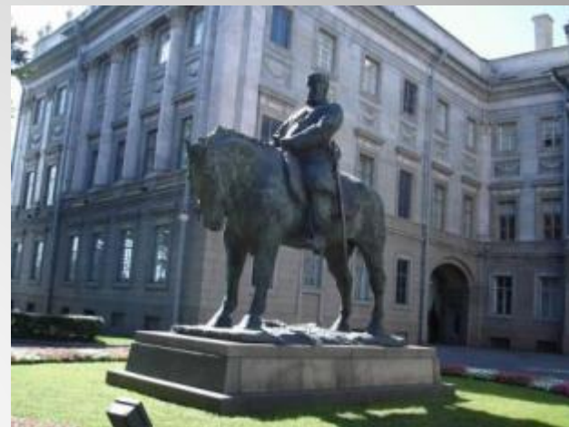
Москва. Памятникъ императору Александру III.