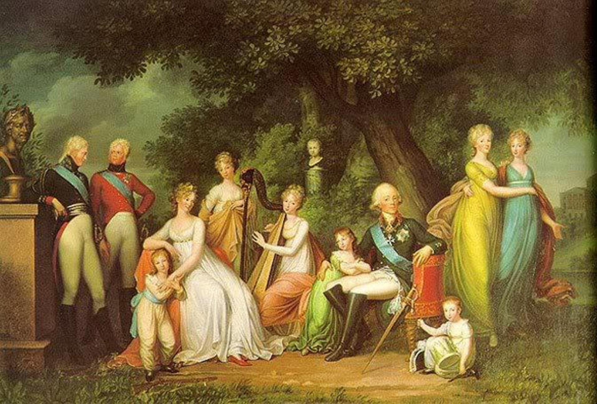
Старший сын императора Павла1