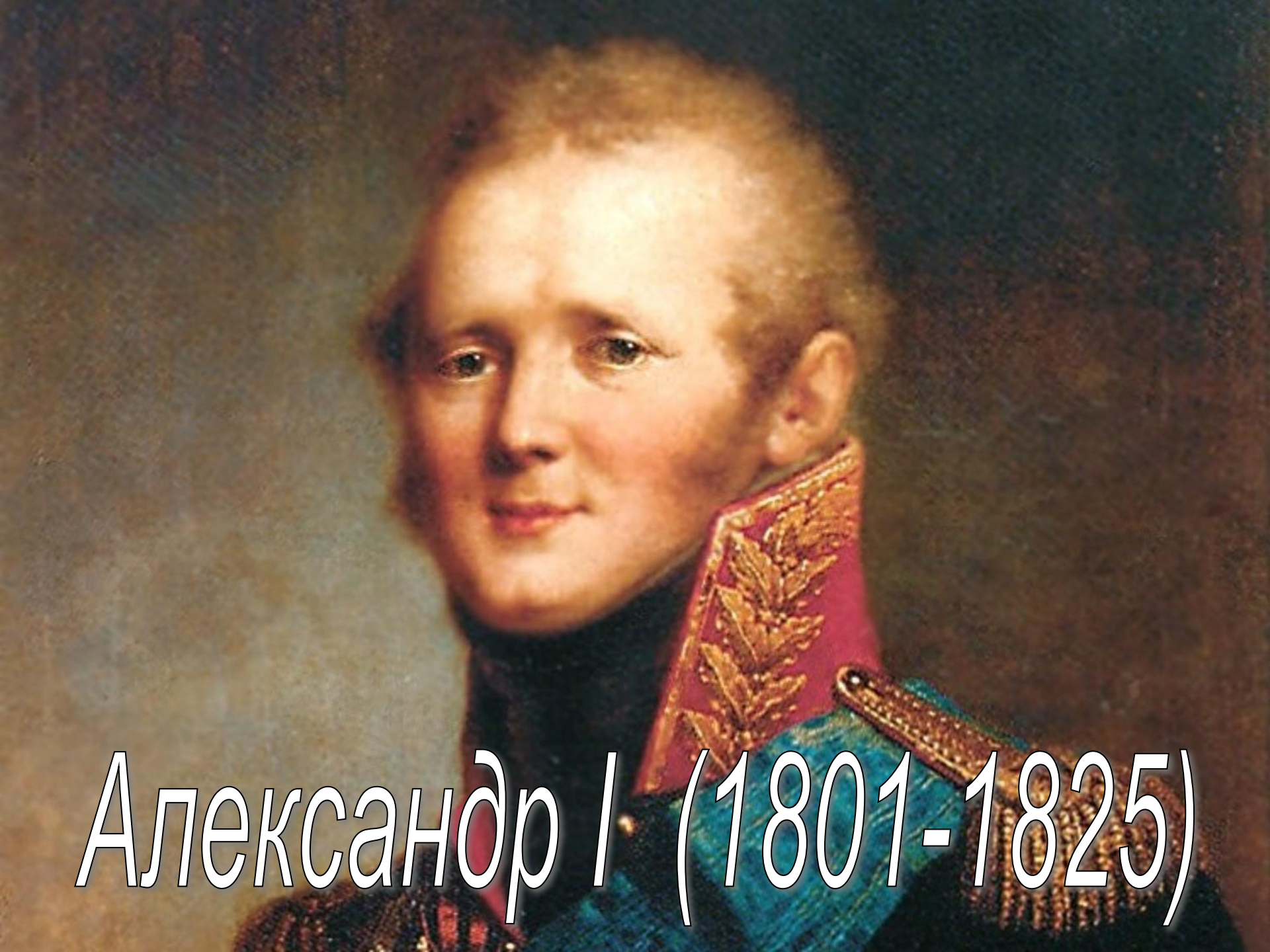
Александр I (1801-1825)