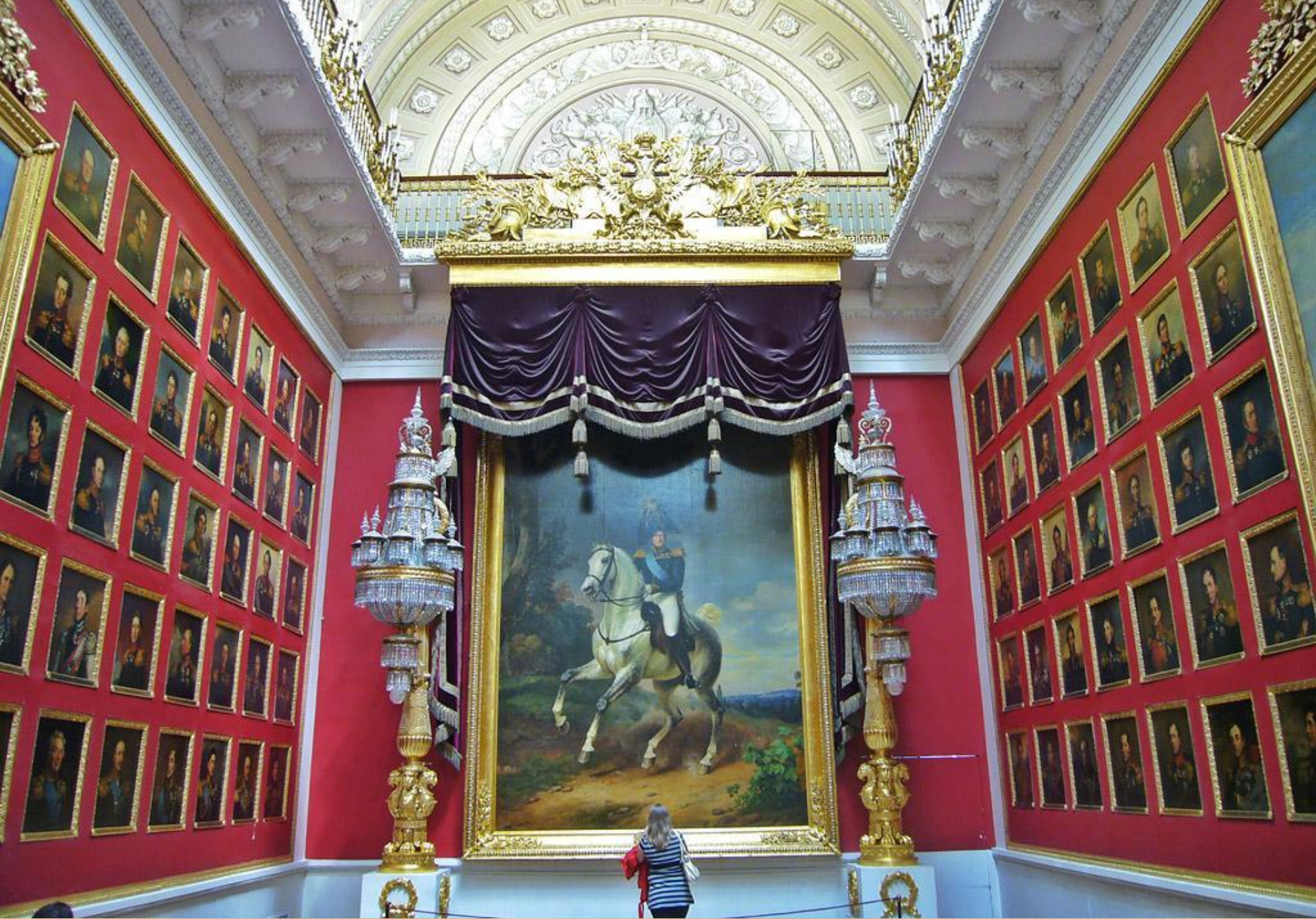
Эрмитаж «зал 1812 года»