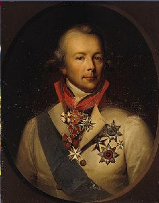
Лидер заговорщиков граф Пётр Алексеевич Пален