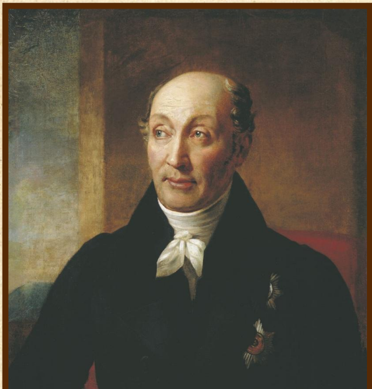
Михаил Михайлович Сперанский