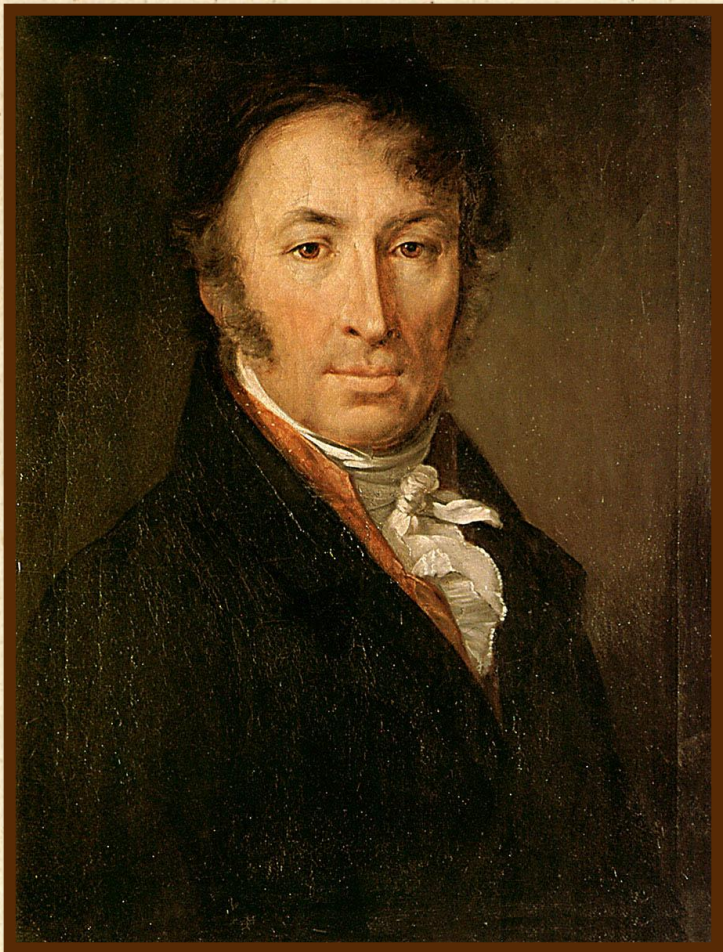
Николай Михайлович Карамзин