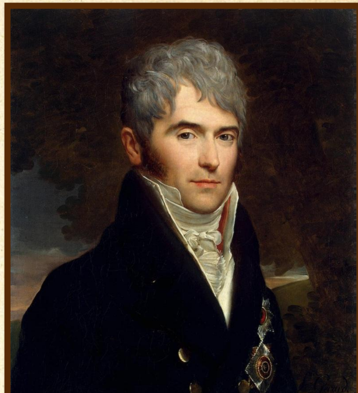
Виктор Павлович Кочубей