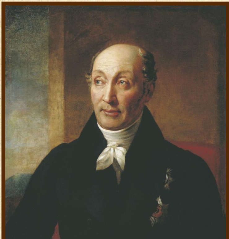
Михаил Михайлович Сперанский