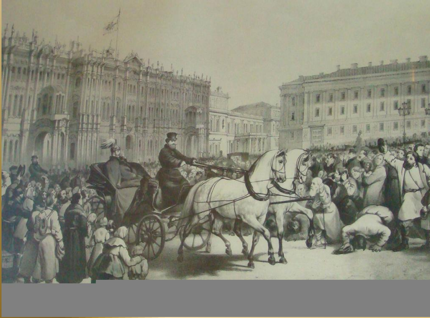
Крестьяне благодарят Александра II