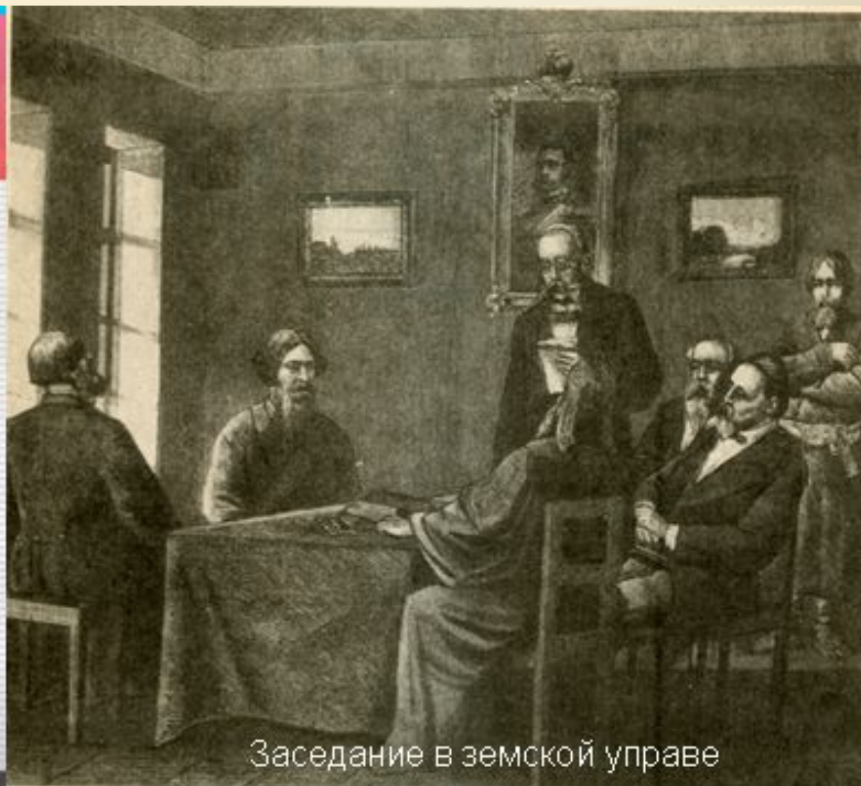
Заседание в земской управе