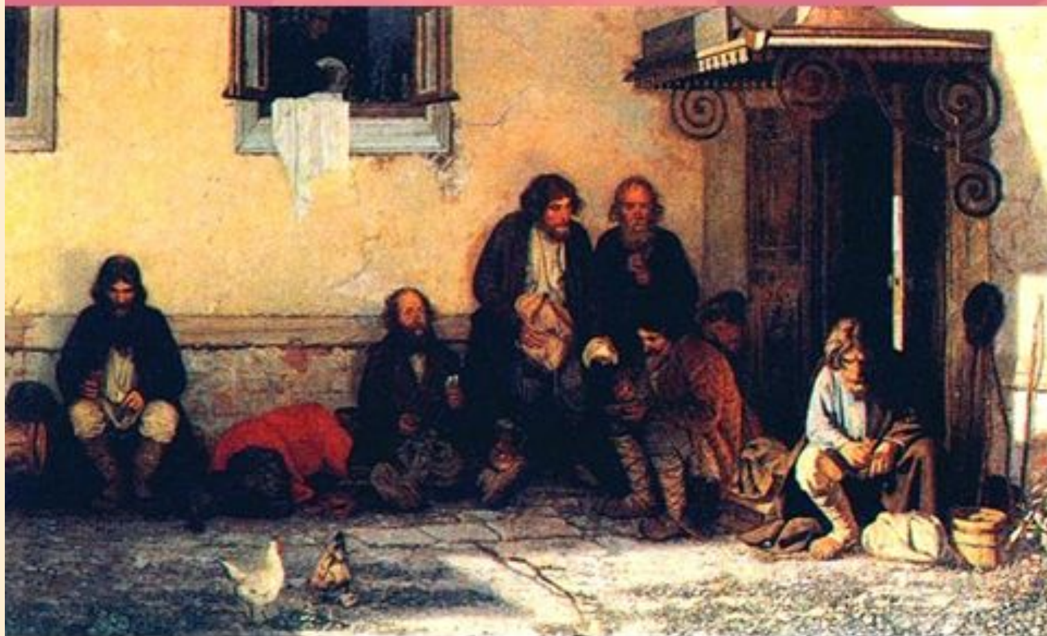
Г.Мясоедов. «Земство обедает»