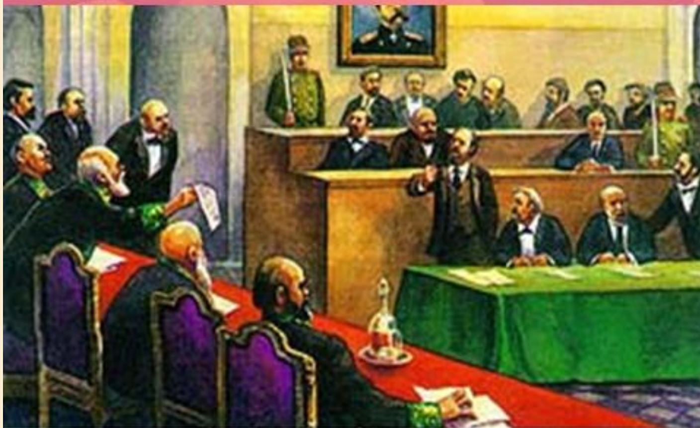
Суд присяжных при Александре II