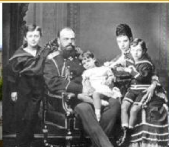
Александр III с семьей