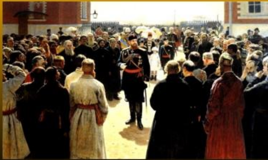
Прием волостных старшин императором Александром III