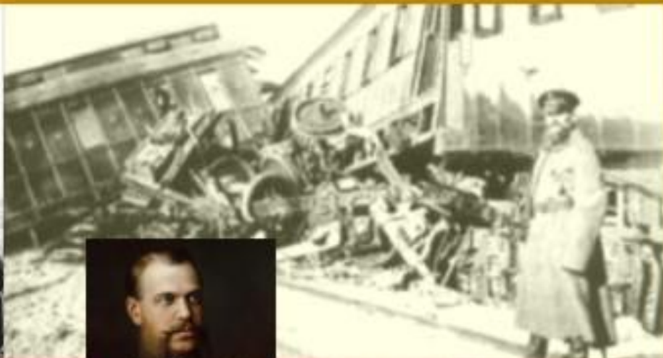
в октябре 1888 г.