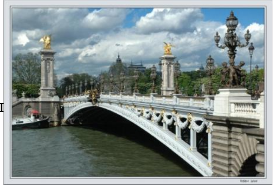
Мост Александра III в Париже