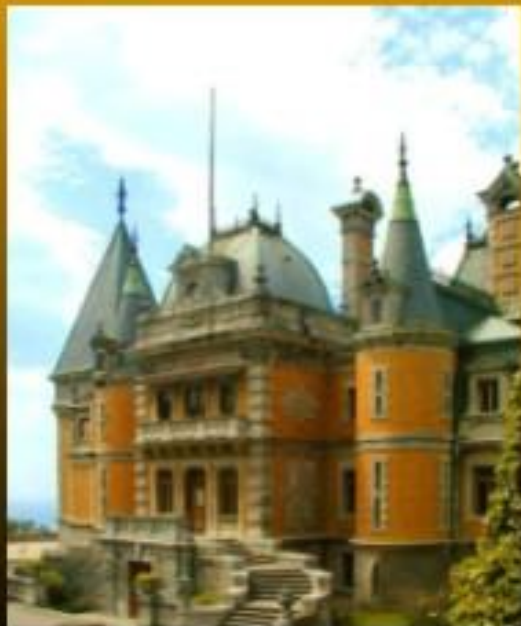
Дворец Александра III в Крыму