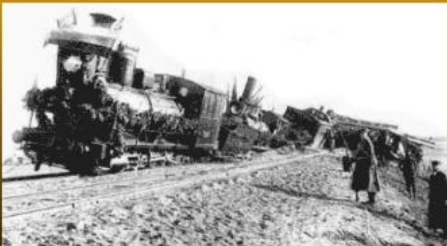
Катастрофа императорского поезда под Харьковом