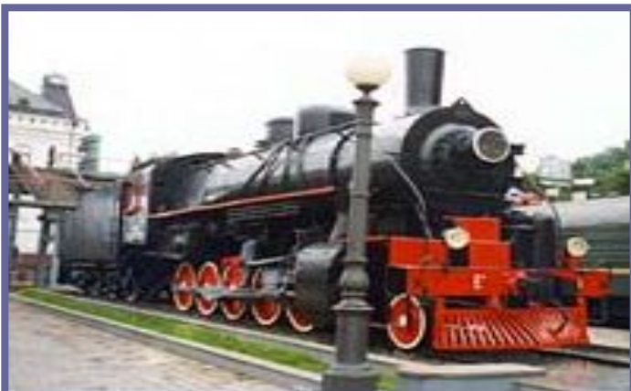
Владивосток. Памятник паровозу, который долгое время «трудился» на Транссибирской железнодорожной магистрали.