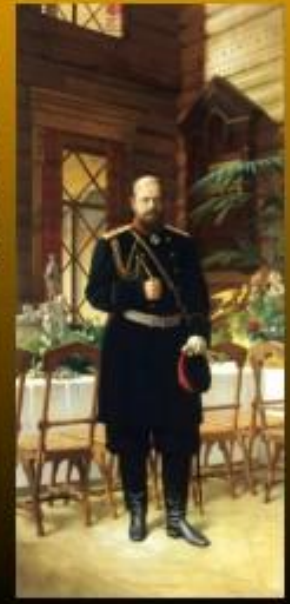
Прием волостных старшин императором Александром III