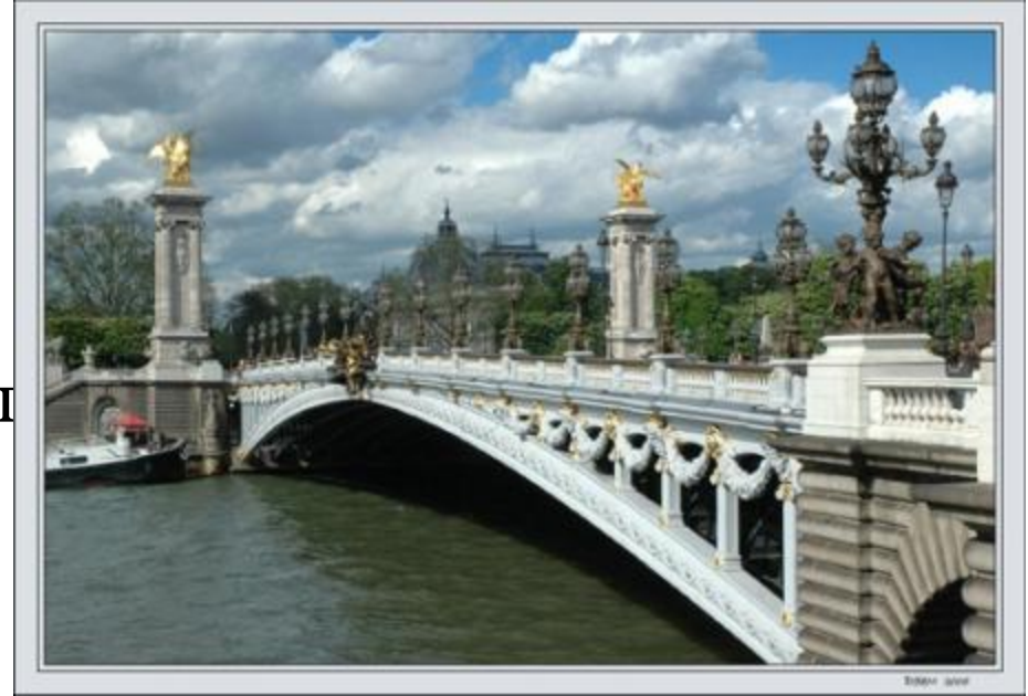
Мост Александра III в Париже