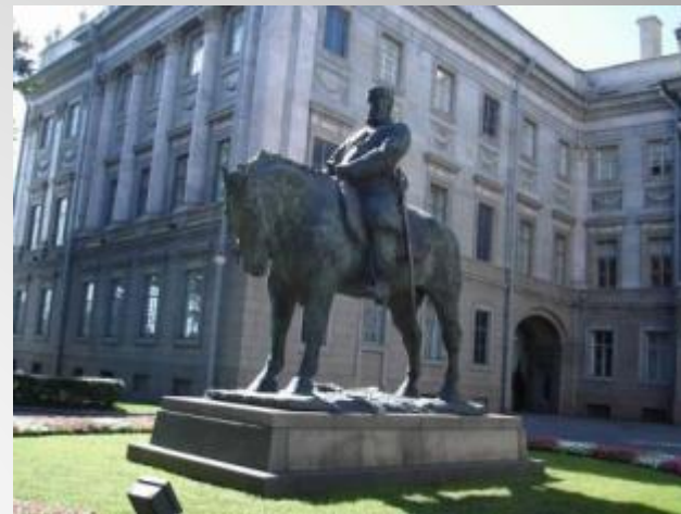
Москва. Памятникъ Императору Александру III.