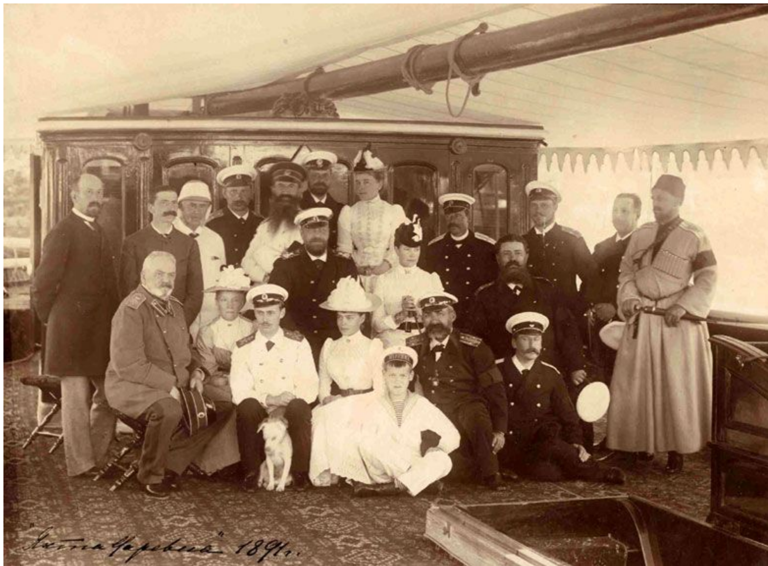
"Летняя Флотилия" 1894г.