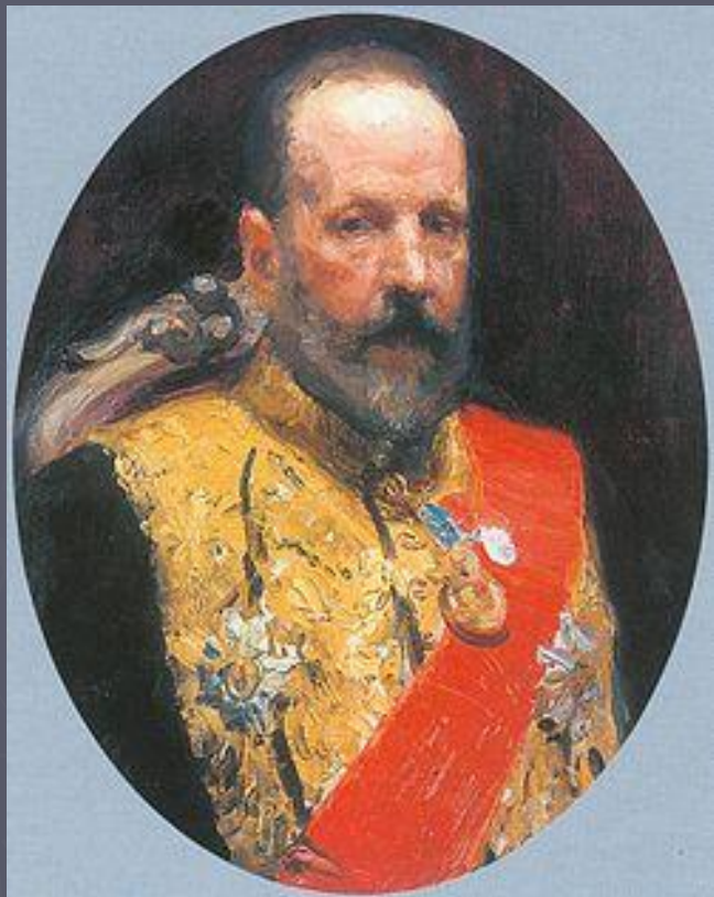
С.Ю.Витте. Министр финансов с 1892г.