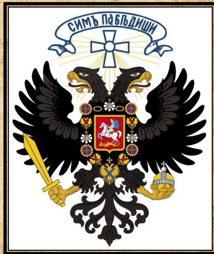
Государственный герб, использованный при А. В. Колчаке

Колчак остался командующим флотом и продолжал успешные боевые действия на море. Но матросские волнения и повсеместный развал дисциплины привели к тому, что в июне 1917 г. Колчак был вынужден сложить с себя полномочия. После этого он уехал в Америку, где активно сотрудничал с американским генералом Гленном. Узнав об Октябрьской революции, он решил перейти на службу к англичанам и вскоре оказался в Китае, где собирали и обучали армию для освобождения России от большевиков. В октябре 1918 г. Колчак вместе с одним английским генералом решил пробраться через Сибирь на юг — в Добровольческую армию. В то время в Сибири советская власть была свергнута в результате восстания Чехословацкого корпуса. Видимо, поэтому Колчак не поехал дальше, а остался в Сибири.