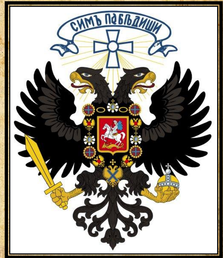
Государственный герб, использованный при А. В. Колчаке

Колчак остался командующим флотом и продолжал успешные боевые действия на море. Но матросские волнения и повсеместный развал дисциплины привели к тому, что в июне 1917 г. Колчак был вынужден сложить с себя полномочия. После этого он уехал в Америку, где активно сотрудничал с американским генералом Гленном. Узнав об Октябрьской революции, он решил перейти на службу к англичанам и вскоре оказался в Китае, где собирали и обучали армию для освобождения России от большевиков. В октябре 1918 г. Колчак вместе с одним английским генералом решил пробраться через Сибирь на юг — в Добровольческую армию. В то время в Сибири советская власть была свергнута в результате восстания Чехословацкого корпуса. Видимо, поэтому Колчак не поехал дальше, а остался в Сибири.