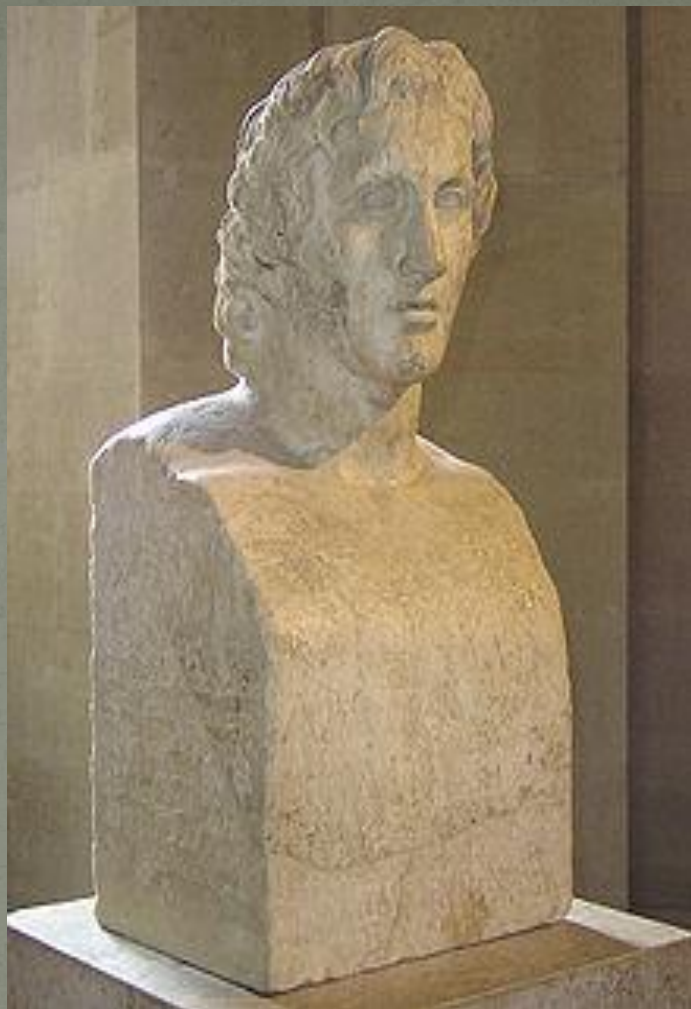
Римская копия с работы Лисиппа. Одна из наиболее достоверных работ по внешности Александра (музей Лувра)