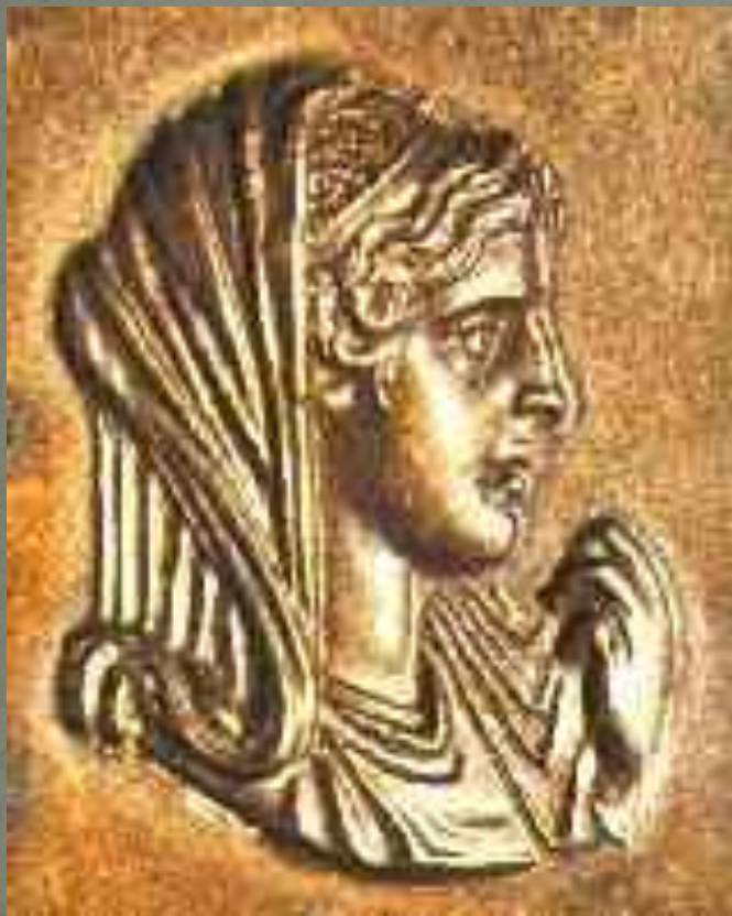
Олимпиада, мать Александра (золотой барельеф)