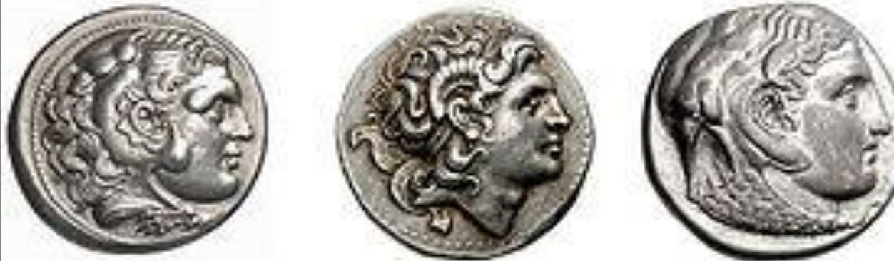
Портреты Александра Великого на монетах, выпущенные после его смерти

Александр Македонский на античных монетах чаще всего изображался с головным убором Геракла (головой льва) или рогами бога Аммона