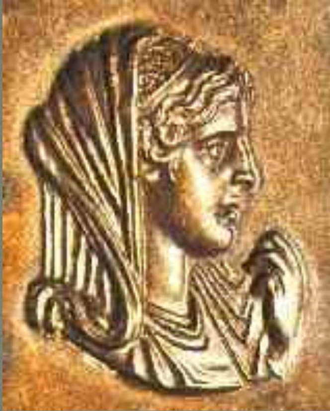
Олимпиада, мать Александра (золотой барельеф)