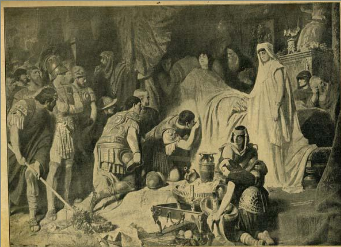
Александр Македонский прощается перед смертью со своими войнами.