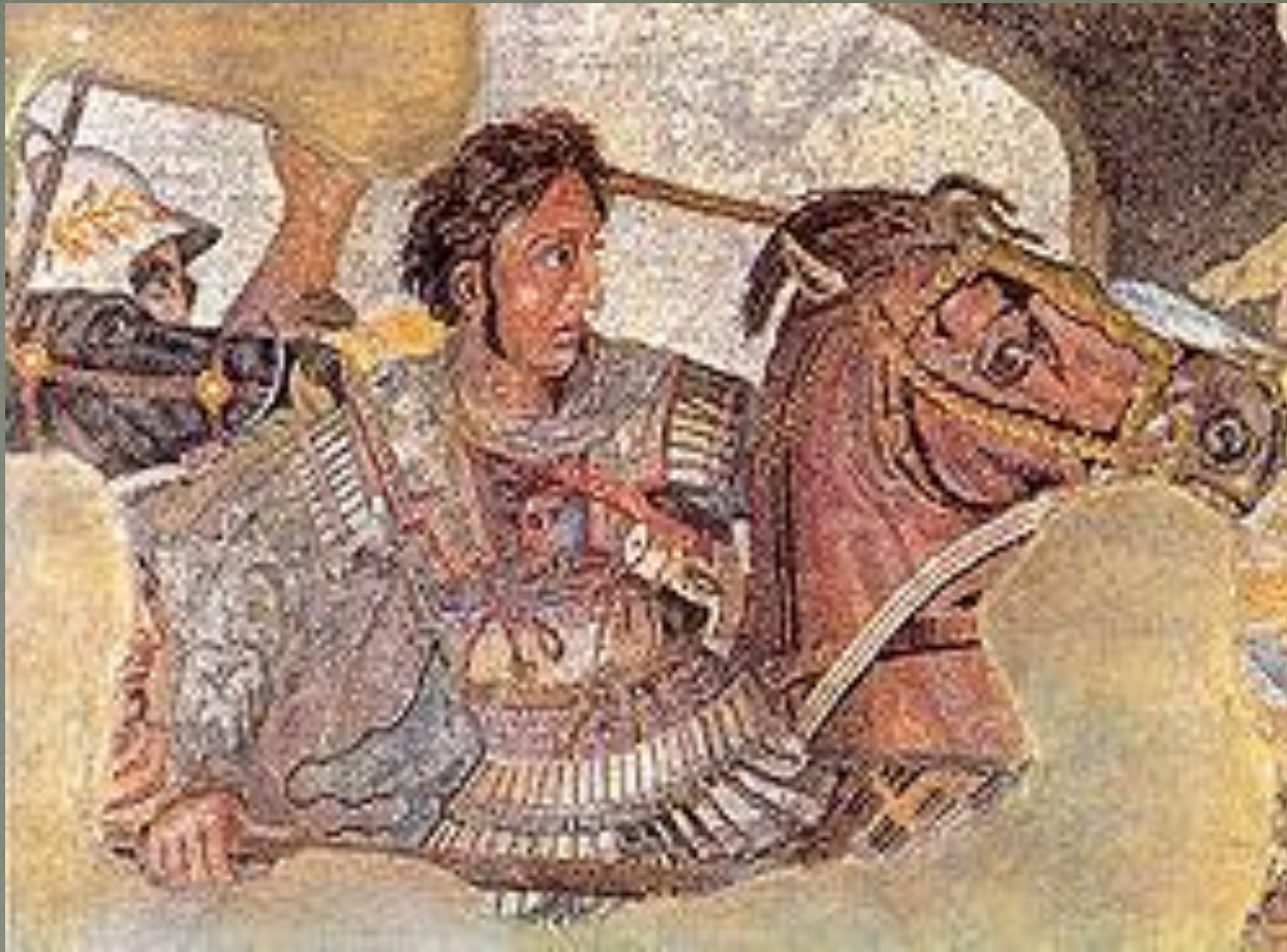
Александр Македонский на фрагменте древнеримской мозаики из Помпей, копия с древнегреческой картины