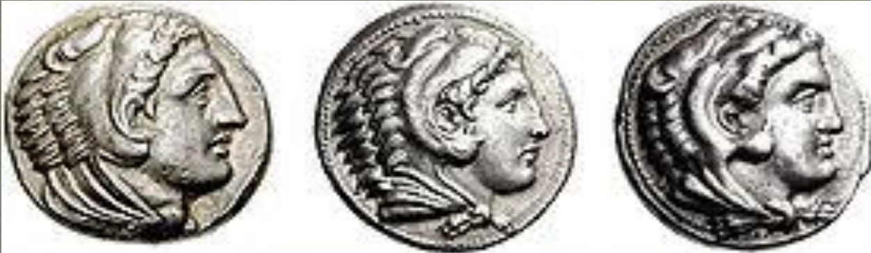
Портреты Александра Великого на монетах, выпущенные при его жизни