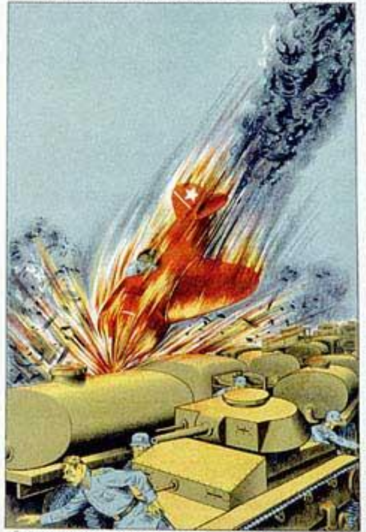
Слетая в пропасть вместе с самолетом под командой полка Героя Советского Союза капитана Н. Ф. Гастелло, советские летчики и экипажи бомбардировщиков и истребителей сражались до последнего дыхания с фашистскими самолетами. Задача их — разгромить врага в Советском небе.

Иллюстрация: В. С. Савицкий. Художник: В. С. Савицкий. Художник: В. С. Савицкий.