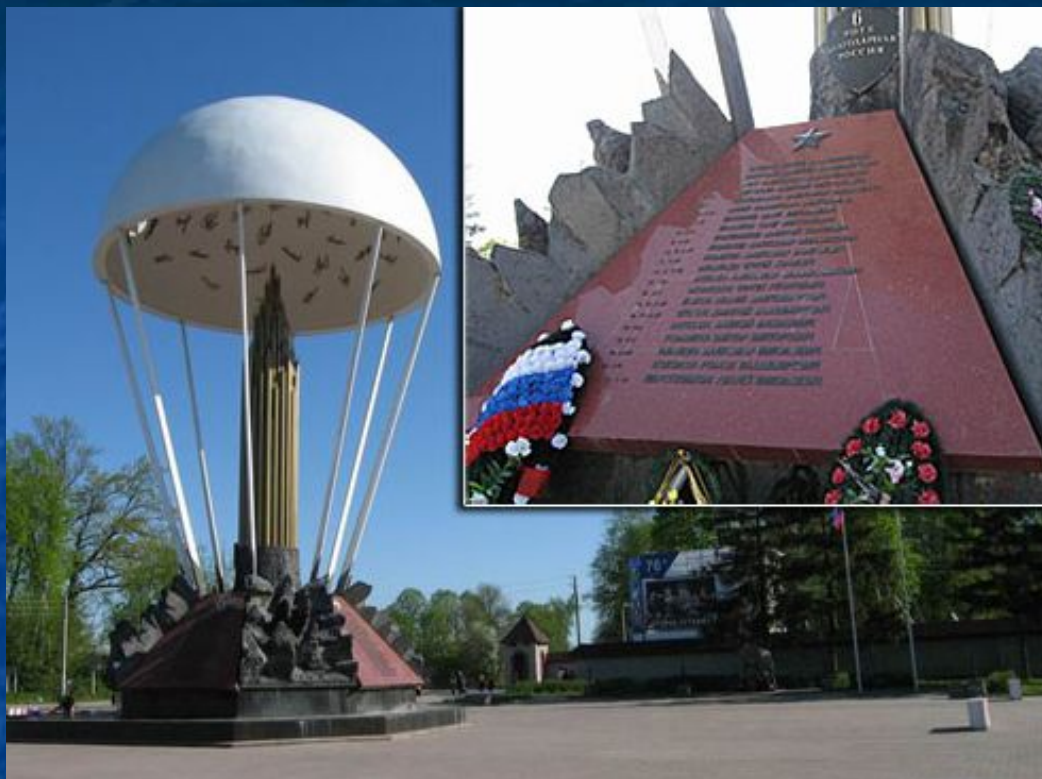
г.Псков, памятник 6-й роте.